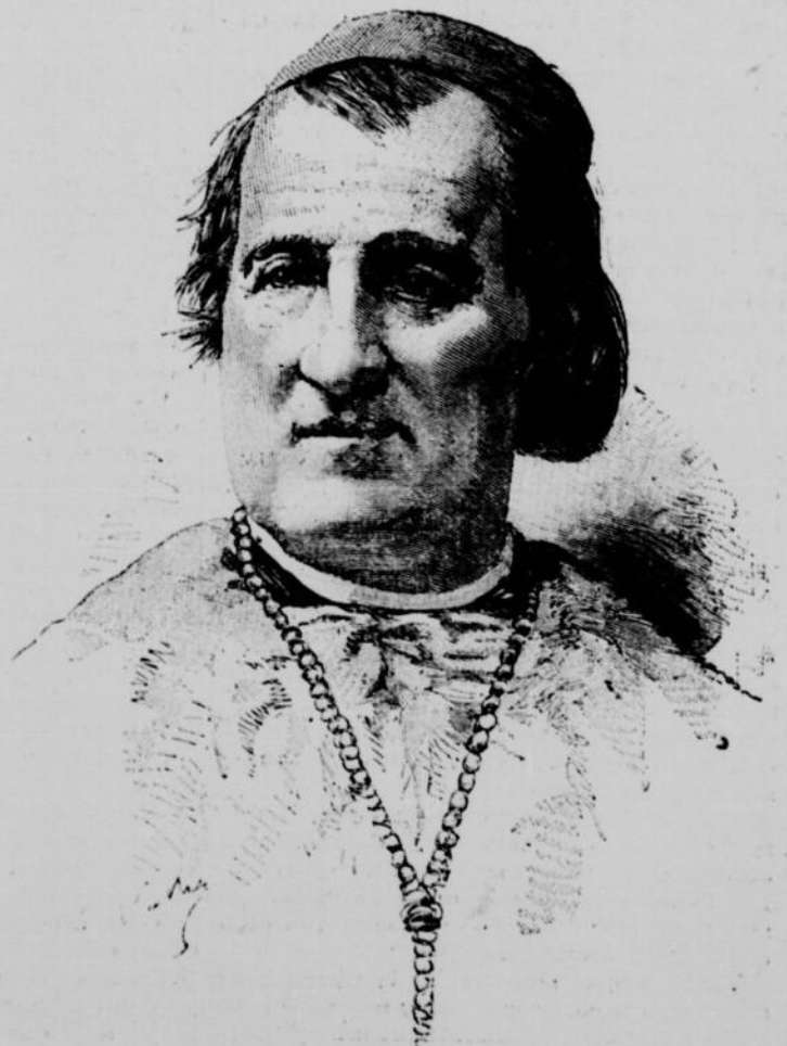
MGR CAVEROT, CARDINAL-ARCHEVÊQUE DE LYON, DÉCÉDÉ