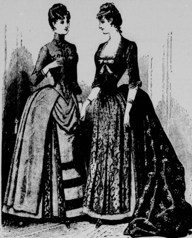
No 1. Toilette en soie faille. No 2. Toilette en brocart.

No 1.—Toilette en soie à grosses côtes paille, passementerie de soie noire et bandes de velours. Jupe de soie formant à droite et à gauche gros plis creux, intérieur bordé des deux côtés d'une passementerie de soie. Tablier à l'italienne orné de trois larges rubans de velours. Tunique tombant droit sur les côtés et formant gros plis creux derrière. Une petite écharpe est drapée devant, tombant sur le tablier et rentrant sous les côtés de la tunique. Corsage uni formant pointe devant et orné sur le milieu du devant et sur les côtés de trois bandes de passementerie, bas de manches assortis.