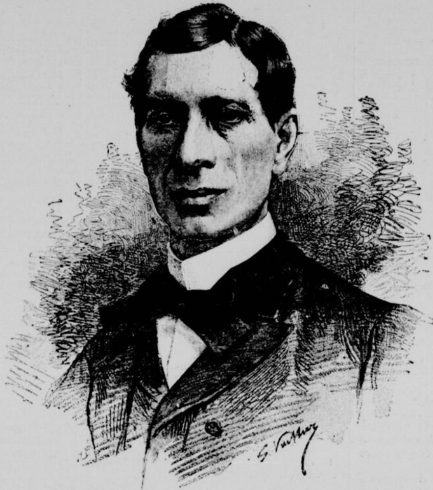
M. ÉDOUARD HERVÉ, DE L'ACADÉMIE FRANÇAISE

ABONNEMENTS : Six mois : $1.50. — Un an : $3.00