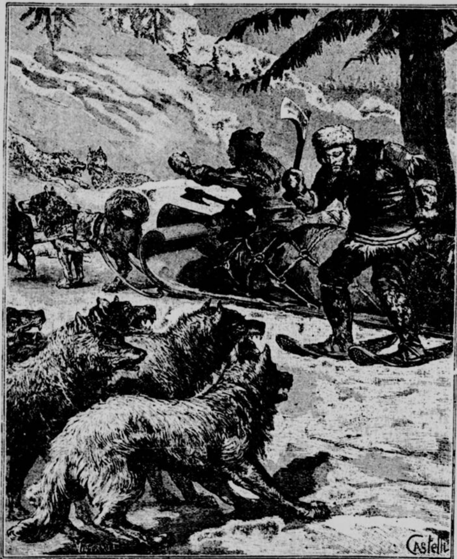
Les loups s'abattirent autour de nous.—Page 358, col. 1.

Mais quelle absurdité, pour un Européen ou un homme blanc quelconque, de s'attribuer vaniteusement la découverte d'une terre, d'un fleuve, d'un lac, que nombre de ses semblables ont habités, parcourus ou possédés avant lui, par cela seul que