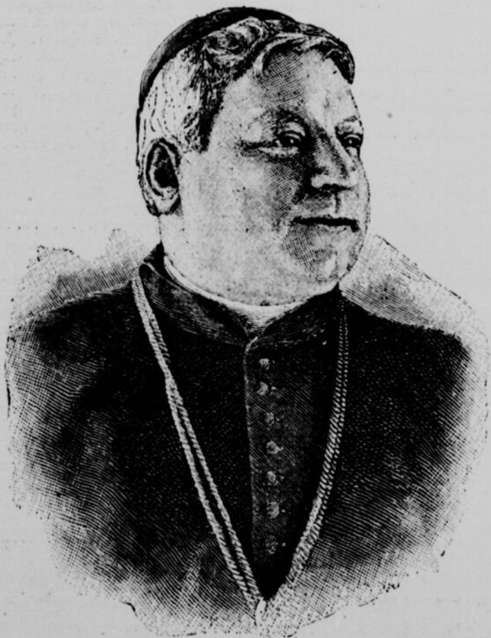
LE CARDINAL JACOBINI, SECRÉTAIRE D'ÉTAT DE LÉON XIII, DÉCÉDÉ