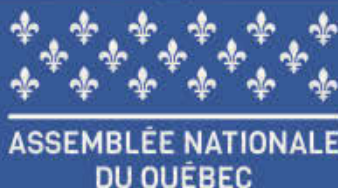
ASSEMBLÉE NATIONALE DU QUÉBEC