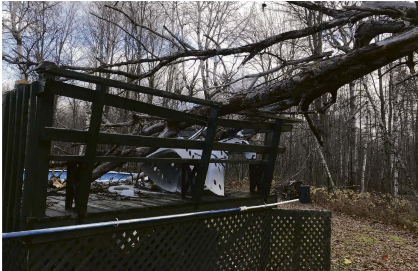
Plusieurs arbres de la région n'ont pas résisté aux vents violents de vendredi, dont celui-ci à Acton Vale.

Ce dernier ajoute que, lors d'une tournée effectuée dans plusieurs résidences, on a dû intervenir au niveau