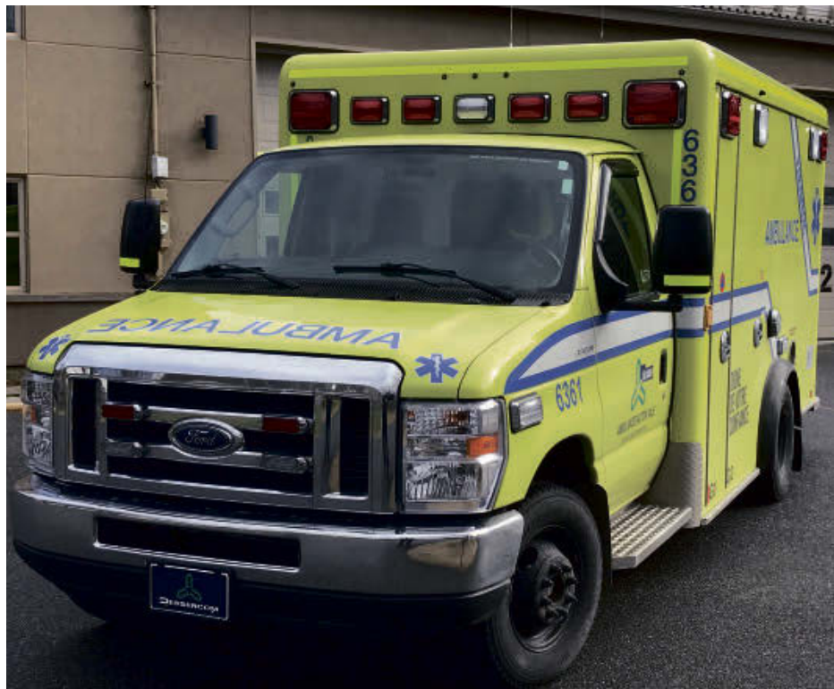
Les paramédics d'Acton Vale pourront desservir encore mieux - et plus rapidement - la population grâce à l'abolition des horaires de faction.

« Le gouvernement a été à l'écoute et a travaillé très fort pour en arriver à ce résultat. À Acton Vale, c'était urgent de régler la situation et les paramédics pourront ainsi accomplir encore mieux leurs fonctions, ce qui contribuera à sauver des vies », confie-t-il.