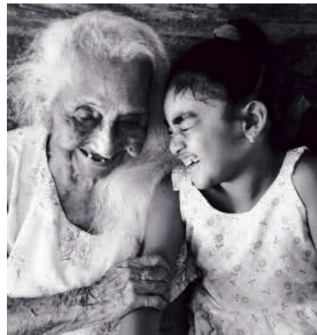
On voit ici une des photos présentée aux Prix Focus, soit « Trinidad », également exposée au Festival Della Fotografia Etica, en Italie, en plus d'avoir remporté le prix Remarquable Artwork, au Siena International Photo Awards, dans ce même pays.