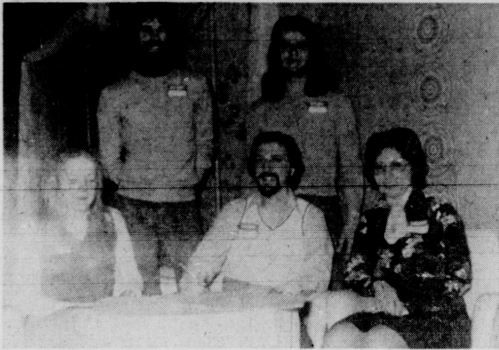
A la Jeune chambre de Princeville

Une autre activité sociale qui est maintenant une coutume bien établie à la Chambre de commerce de Plessisville est la rencontre annuelle des premiers jours d'une nouvelle année. Pour cette manifestation des Fêtes, pas de programme déterminé, aucun conférencier invité, on se contente du mot de bienvenue du président, d'échanges de vœux et souhaits, le tout complété par une dégustation de friandises et de breuvages en rapport avec les goûts des participants.