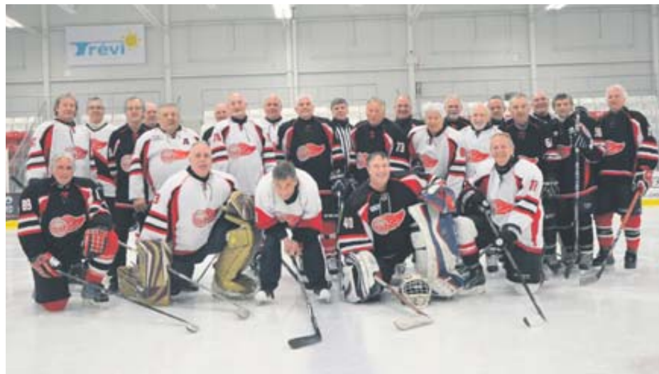
Les joueurs de l'ex-Ligue des 40 portent maintenant les uniformes de la Ligue des Bébés-Boomers.

Dans l'ex-Ligue des 40, devenue celle des Bébés-Boomers, se trouvait une taupe,