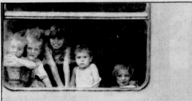
Ces enfants croates de Bosnie jouaient hier dans des wagons abandonnés près de la ville musulmane de Mostar.

ZAGREB (AFP, CP, AP, Reuter) — Des Casques bleus français et canadiens ont été pris, samedi, sous le feu de l'armée croate, alors qu'ils s'employaient à évacuer deux soldats français blessés par l'explosion d'une mine, dans la région de Medak (sud de la Croatie), a annoncé hier à Zagreb la Force de protection de l'ONU (FORPRONU).