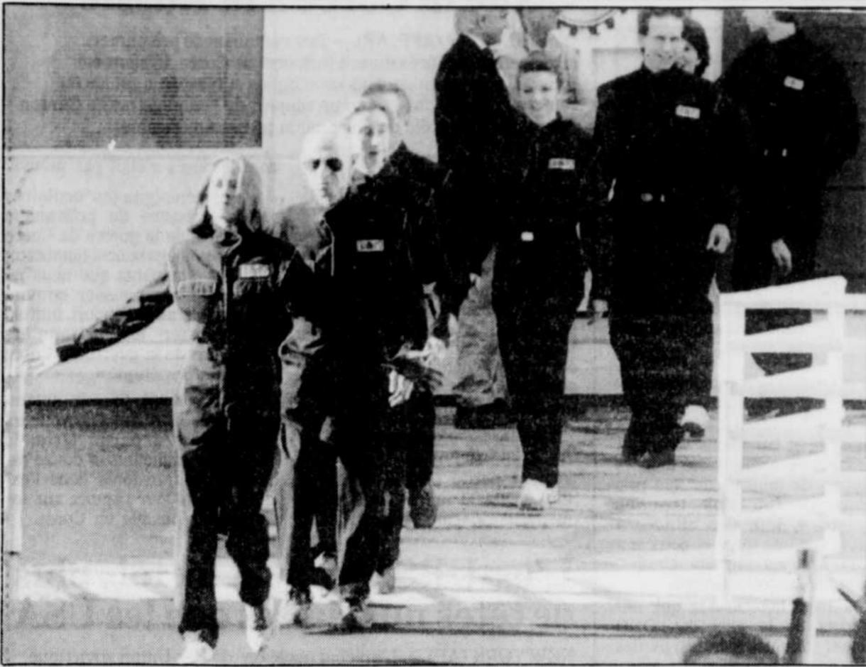
Les huit « Biosphériens » américains sont sortis hier de leur « bulle » en Arizona.