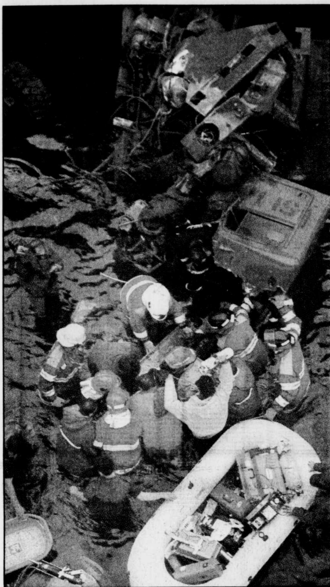
Tout un bataillon de secouristes, devant travailler dans un mètre d'eau, ont mis plus d'une demi-heure pour sortir le jeune militaire qui était resté coincé derrière son volant.