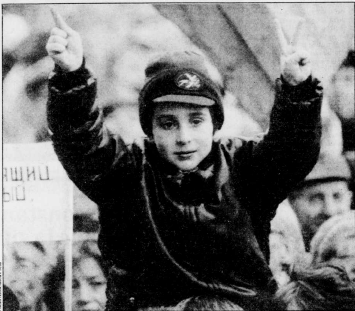
Ce jeune garçon juché sur les épaules de son père scandait des slogans favorables à Eltsine, hier, lors du plus important rassemblement populaire observé au centre-ville de Moscou.

Plus tôt dans la journée, des milliers de manifestants, rassem-