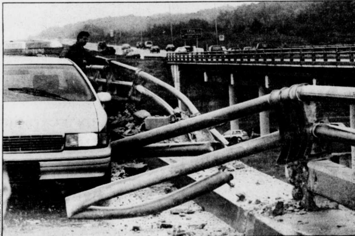
Le camion a enfoncé le parapet du pont avant de plonger dans la rivière Etchemin.

Le porte-parole de l'armée canadienne, le capitaine Pierre Leclerc, a indiqué hier qu'il ignorait les causes exactes de la tragédie. « Est-ce une flaque d'eau, l'inattention, un bris ou la fatigue, qui a fait déraiser le camion, nous l'ignorons. Je dois rencontrer les deux blessés en soirée. L'un est au CHUL, l'autre à l'Hôtel-Dieu de Lévis », souligne-t-il. Aux dernières nouvelles, les chances de survie du conducteur étaient minces.