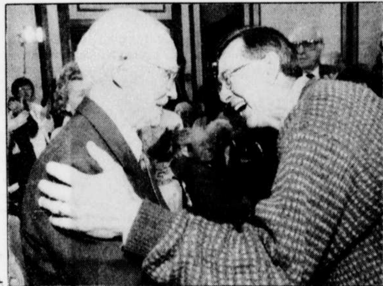
Preston Manning rencontrant l'ancien premier ministre du Manitoba, Douglas Campbell.

La terre noire des Prairies et les riches vallées des Rocheuses sont autant de terres fertiles pour Manning. Depuis Louis Riel, dont se réclame à l'occasion le chef du Parti réformiste, l'Ouest rural a toujours trouvé un « Messie » pour porter le vent de ses révoltes. Et, cinq cents à la fois, le chef des Réformistes fait de ses militants de véritables apôtres. Dans les églises et les temples, les magasins généraux et les concessions de machines agricoles, autour des silos du « wheat bard » local, le bouche à oreille est d'une efficacité redoutable!