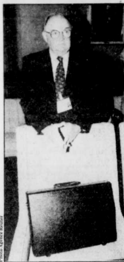
Le ministre Gilles Loiselle quelques instants avant l'ouverture de la séance de travail du Fonds monétaire international, à Washington, hier.

« Nous allons essayer d'avoir le meilleur arrangement possible,