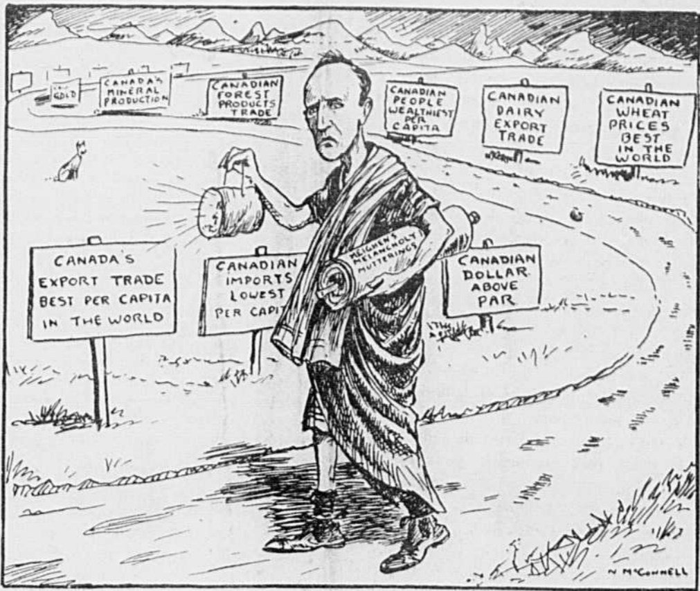
ARTHUR MEIGHEN, armé de la lampe de Diogène cherche partout des raisons de pessimisme et n'en trouve aucune. (Caricature envoyée au Cri par un dessinateur ontarien.)