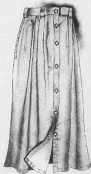
La jupe d'excursion : disponible en kaki, marine ou rouge; 95 $

Les meilleurs vêtements de voyage et d'aventure au monde