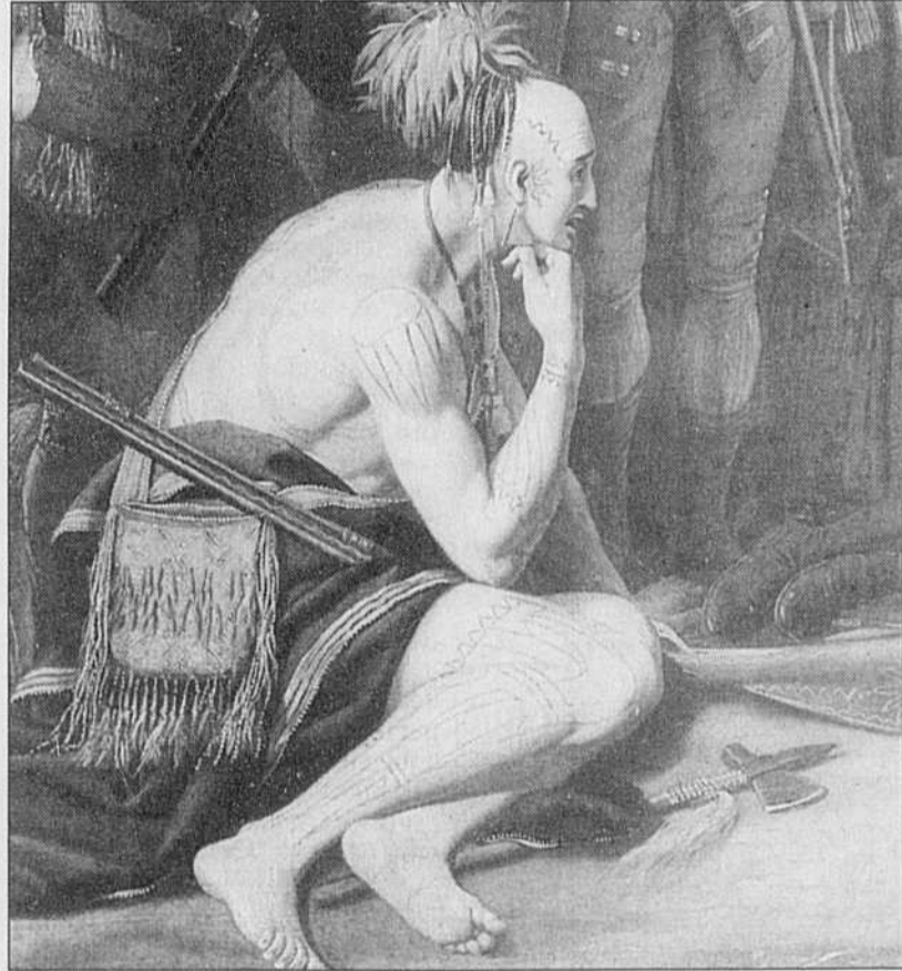
La Mort du général Wolfe, Benjamin West (détail). On y aperçoit un guerrier iroquois assistant à l'agonie du général anglais en 1759.

Ce monde a été bouleversé par l'arrivée des Blancs. Aucune discussion sérieuse sur le choc des cultures. L'Européen est arrivé avec ses gros sabots, a transmis toutes sortes de maladies aux indigènes, s'est emparé de leurs terres, s'est servi d'eux comme cheap labor , les a parqués dans des réserves quand ils ont cessé d'être utiles comme cueilleurs de fourrures, en un mot il a disloqué leurs sociétés et accompli un quasi-génocide. On