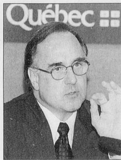
Le ministre de la Santé, Jean Rochon.