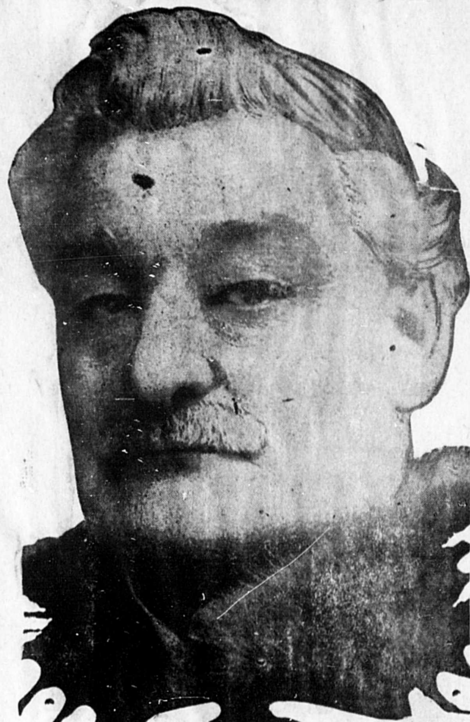
Mount Royal Breweries Limited