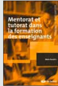
Mentorat et tutorat dans la formation des enseignants