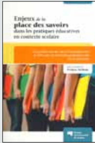
Enjeux de la place des savoirs dans les pratiques éducatives en contexte scolaire