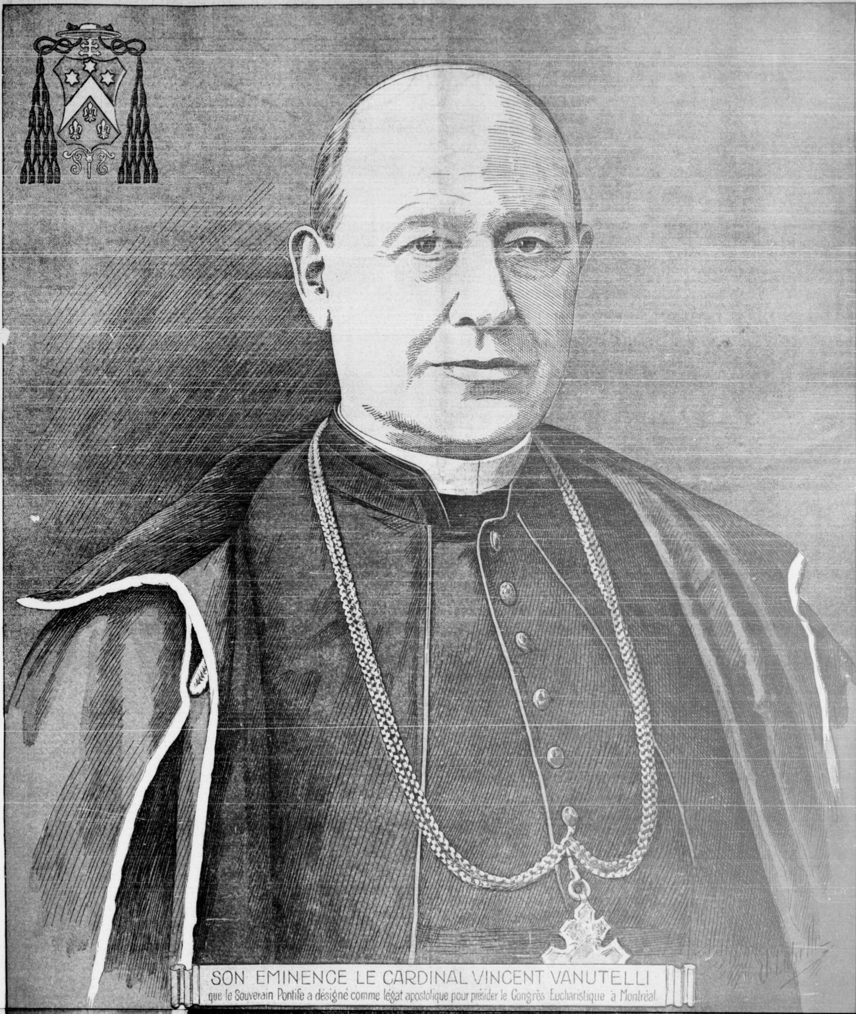
SON EMINENCE LE CARDINAL VINCENT VANUTELLI que le Souverain Pontife a désigné comme légat apostolique pour présider le Congrès Eucharistique à Montréal.