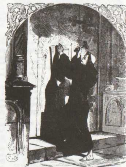
Gravure d'époque montrant Luther appasant ses 95 points de foi à la porte de son église

Interviews : Diane Giguère, Georges Baguet et Charles Temerson Réalisation : Raphaël Pirro