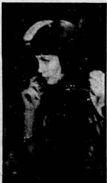
Chloé Ste-Marie dans Ó Picasso, de Gilles Carle.

20:00 — Confidences sur l'oreiller Une excellente comédie, avec Doris Day, Rock Hudson et Tony Randall.