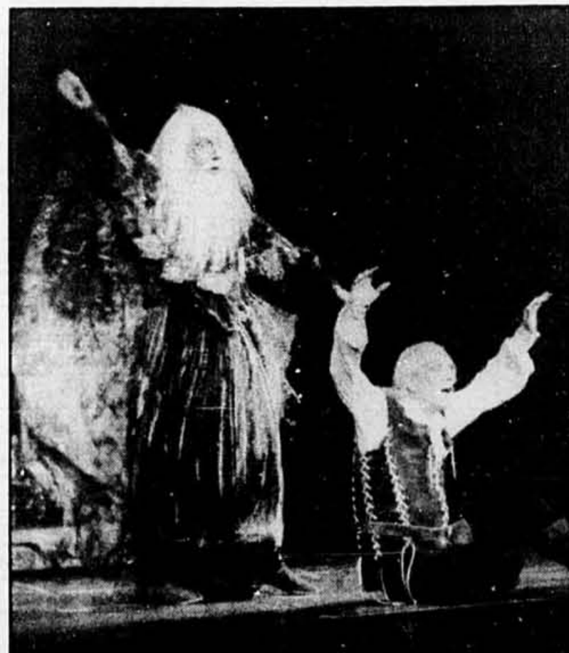
Une scène de Camelot.

C'est beau et d'une étonnante justesse, dans le ton, parfois très comique, en particulier avec le personnage du roi Pellinore. Et c'est surtout merveilleusement mené. Car les nombreux changements de costumes et de décors s'effectuent avec une telle adresse, que c'est à vous en couper le souffle. Je n'arrive pas à me souvenir du nombre de changements de décors, de déplacements d'éléments, de changements de lieu... Les pièces mobiles vont et viennent sur scène, alors que des tentures montent et descendent, sans briser le rythme du spectacle.