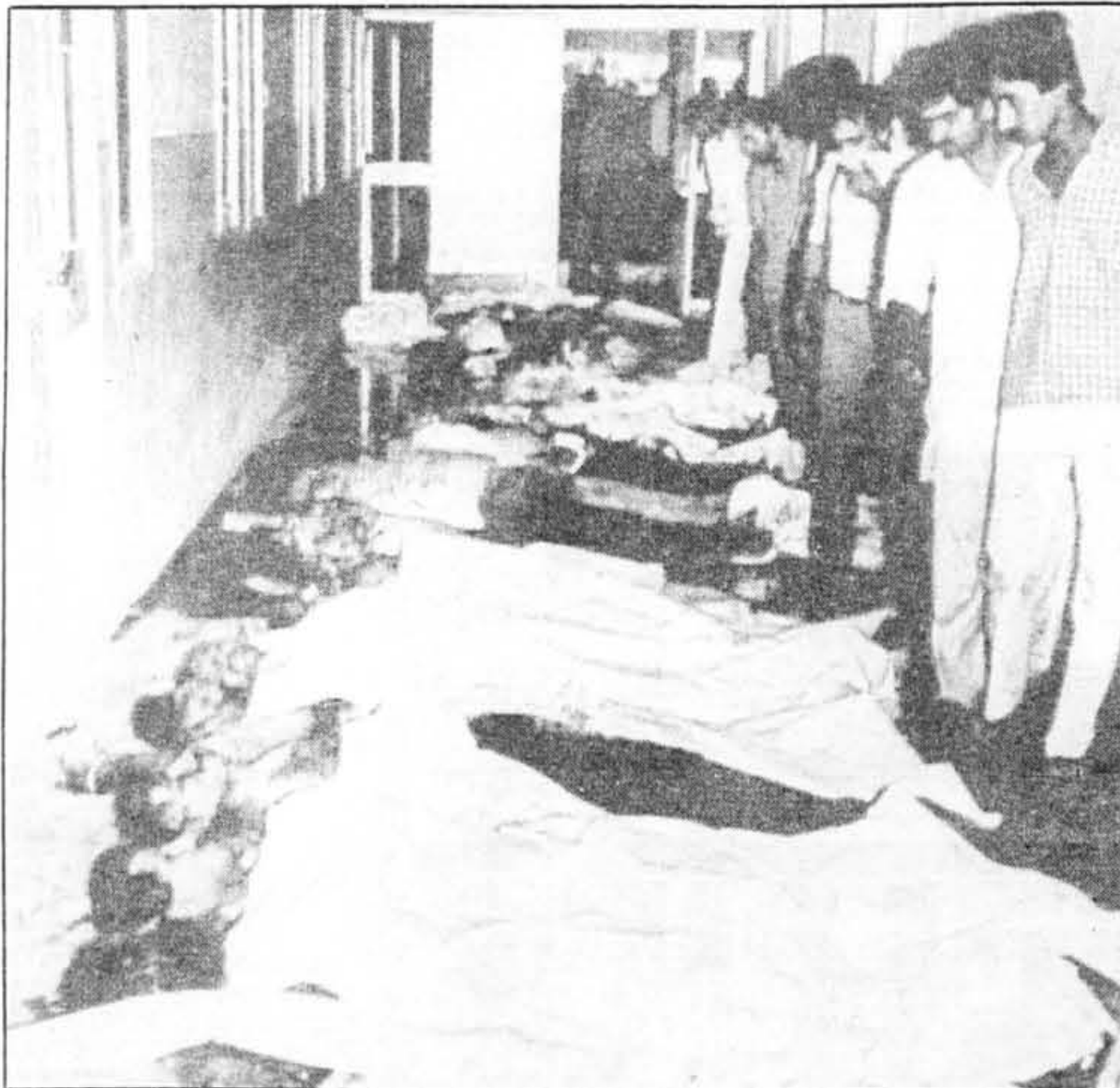
L'identification des victimes des terroristes sikhs qui ont ouvert le feu sur deux autobus, mardi, se poursuit à l'hôpital de Fatehabad.

L'existence du CNG étant inscrite dans la constitution, et un bouleversement des structures du pouvoir étant généralement exclu, la plupart proposent le remplacement des membres du CNG ou son élargissement à des représentants des partis ou des diverses institutions du pays pour les prochains mois.