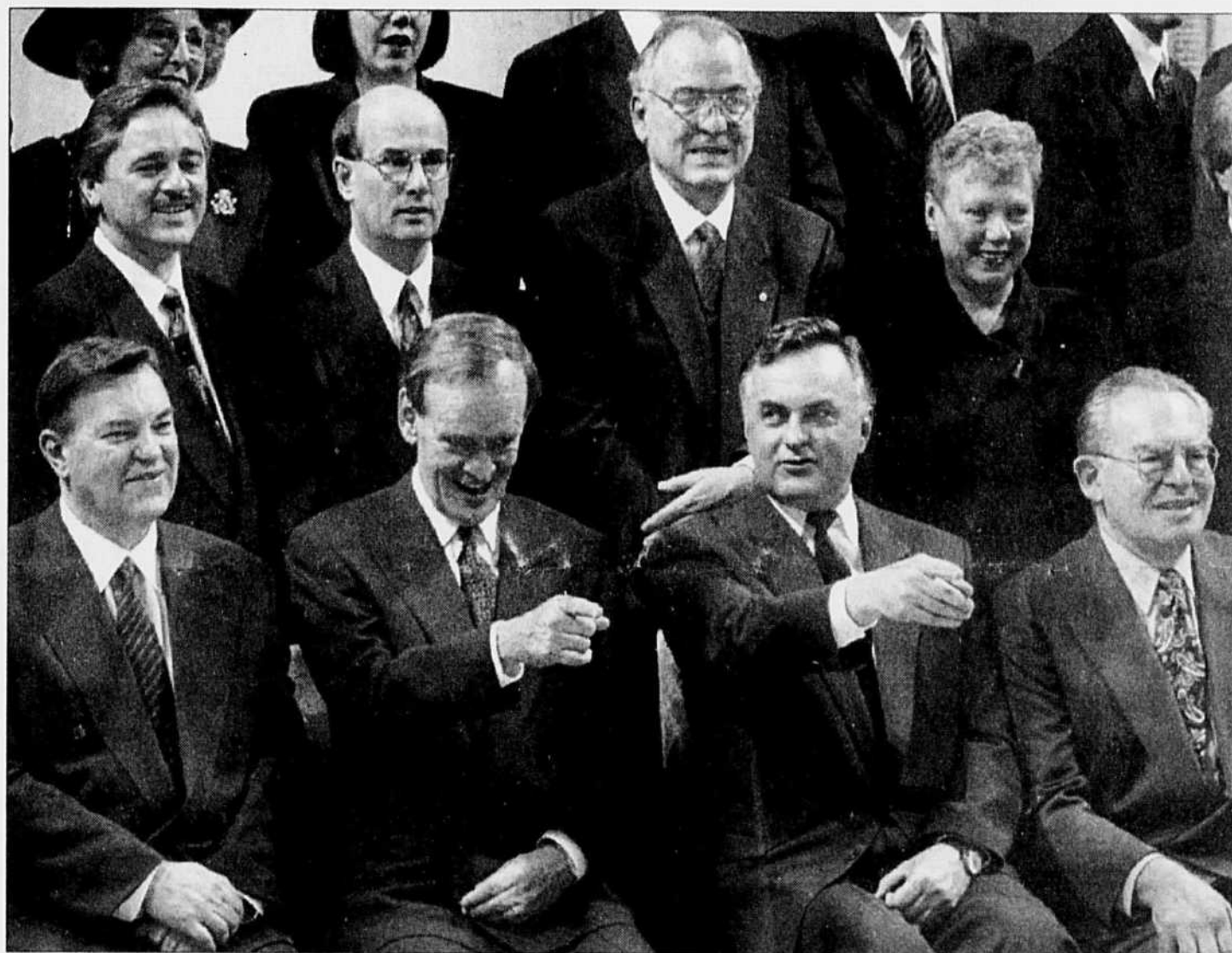
Le premier ministre Jean Chrétien et le gouverneur général du Canada Raymond Hnatyshyn ont tout de même pris le temps de plaisanter hier avec les photographes après l'assermentation des membres du nouveau cabinet. Ils étaient flanqués de M. André Ouellet, à gauche, ministre des Affaires étrangères, et de M. Herb Gray, à droite, Solliciteur général. Derrière eux on reconnaît, dans l'ordre habituel, M. Brian Tobin, ministre des Pêches et Océans, M. David Dingwall, ministre des Travaux publics, Ron Irwin, ministre des Affaires indiennes et du Nord canadien, et Mme Joyce Fairbairn, leader du gouvernement au Sénat.