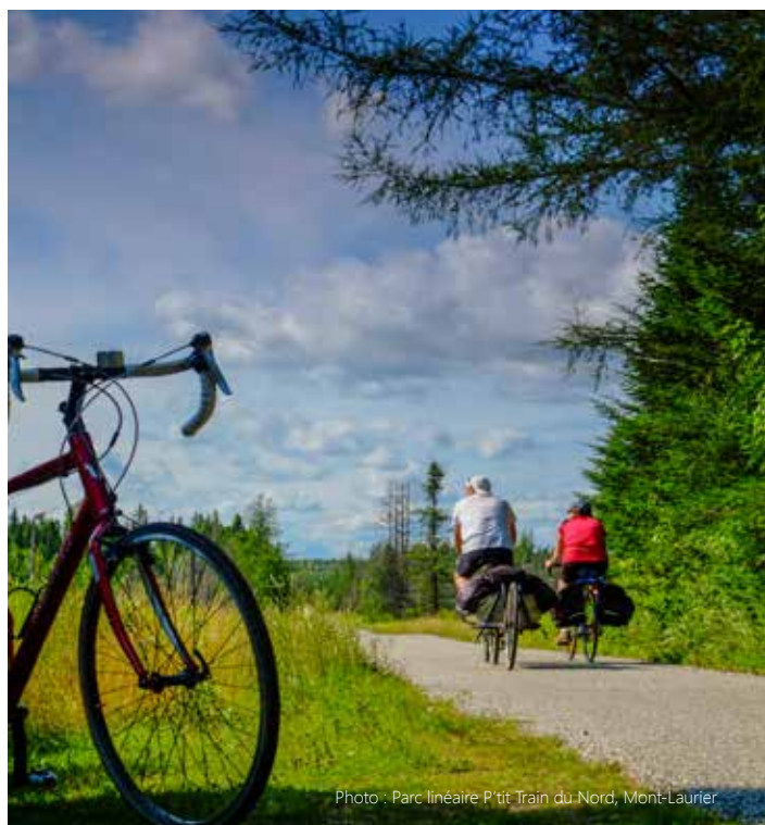
Photo : Parc linéaire P'tit Train du Nord, Mont-Laurier