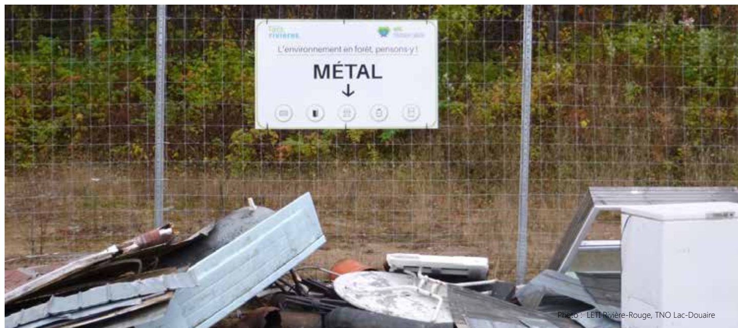
Photo : LETI Rivière-Rouge, TNO Lac-Douaire

signalisation disponible dans le LETI du secteur Rivière-Gatineau constitue la phase 1 du projet. En quelques mois à peine, la MRCAL confirme la réussite de cette phase grâce à la grande collaboration des utilisateurs. Ainsi, le projet pourrait entamer la phase 2 qui vise à étendre la signalisation à tous les LETI de la MRCAL.