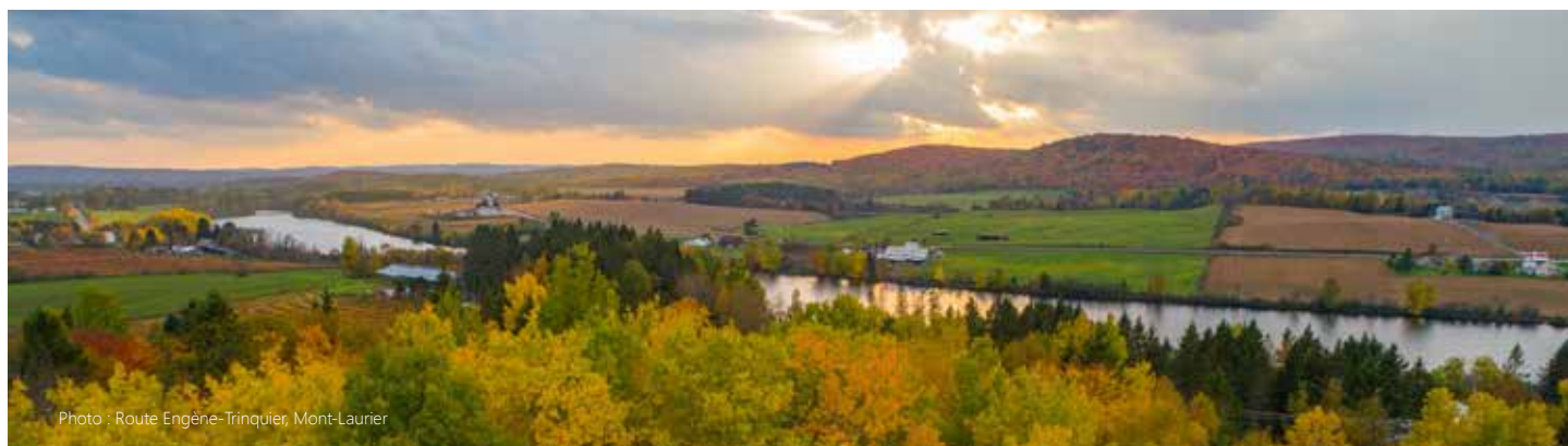
Photo : Route Engène-Trinquier, Mont-Laurier