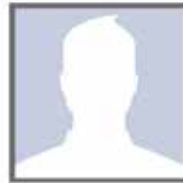
Poste vacant Chargé de projet Internet haute vitesse