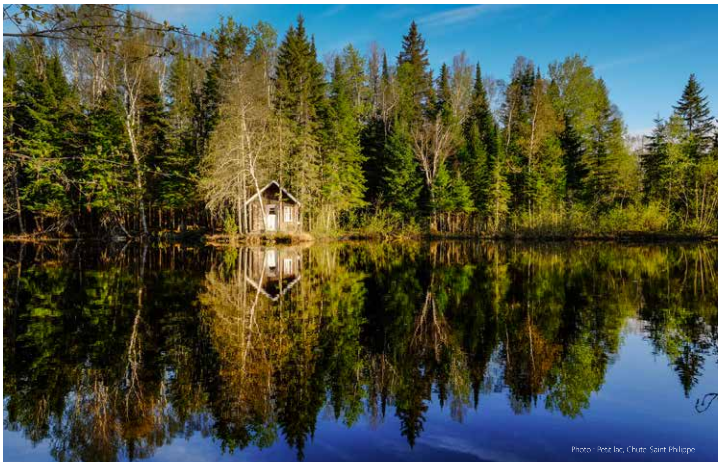
Photo : Petit lac, Chute-Saint-Philippe