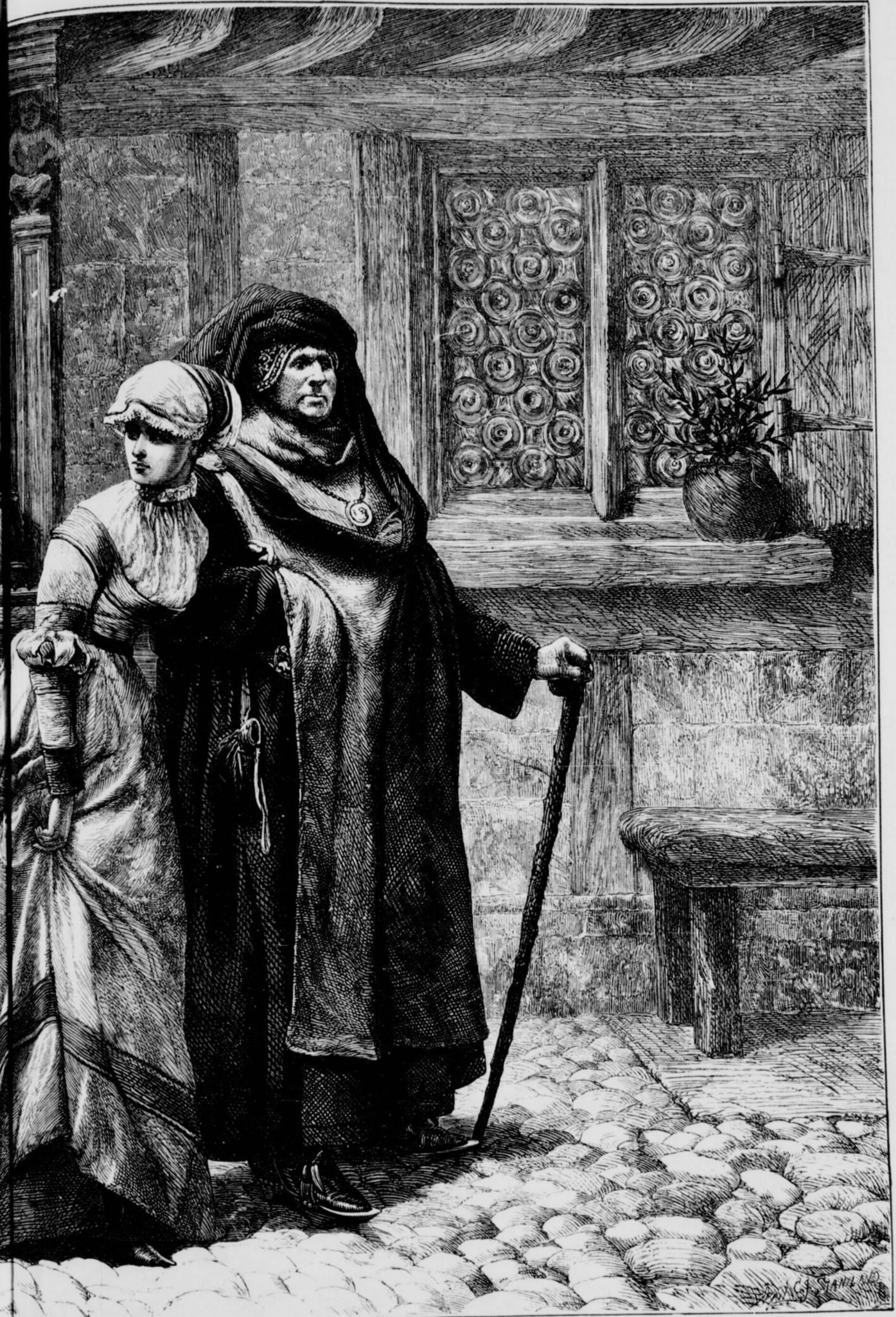
"LA PREMIERE RENCONTRE."