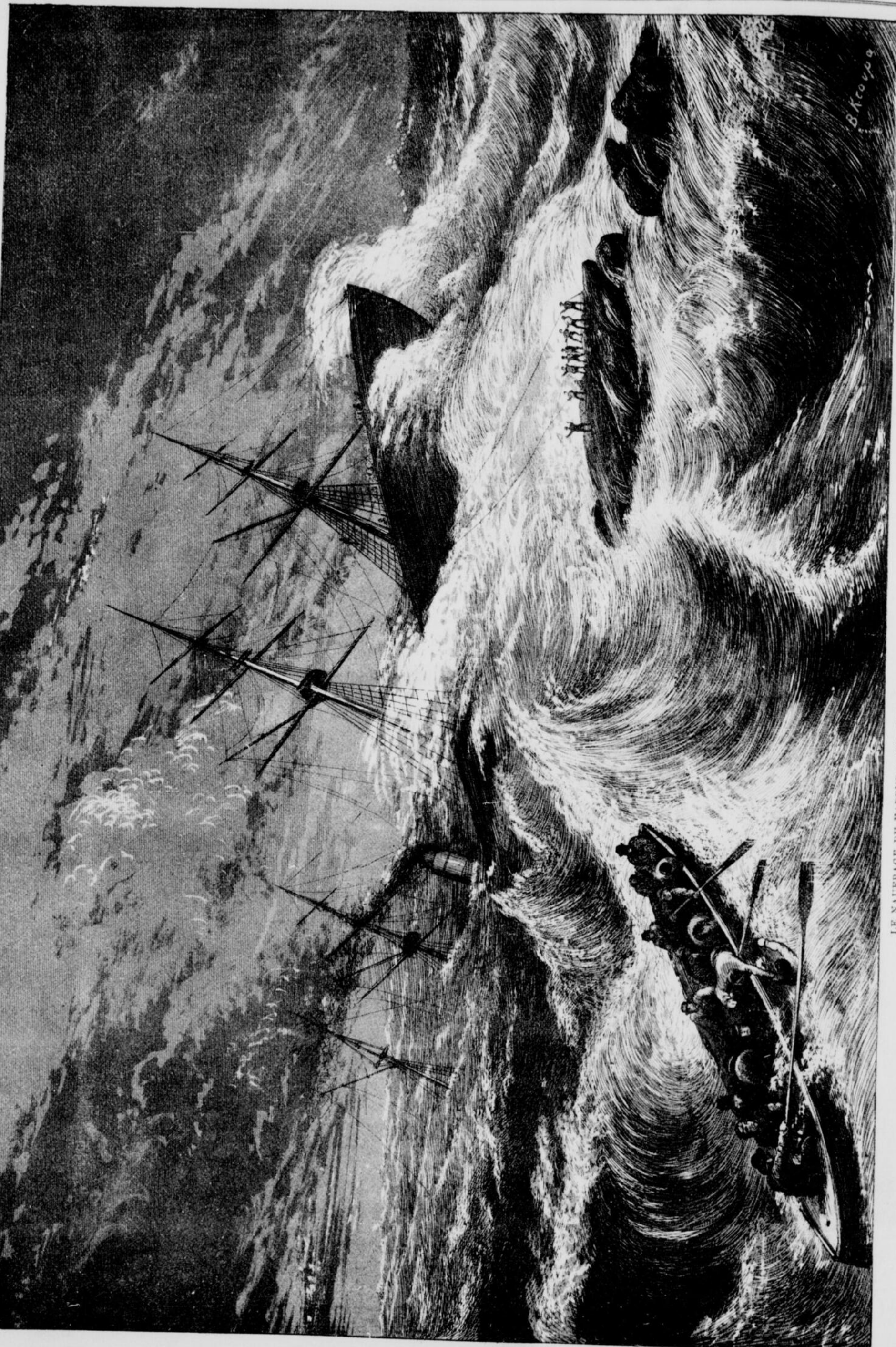
LE NAUFRAGE DU VAPEUR "ATLANTIC" SUR LES COTES DE LA NOUVELLE-ECOSSE.