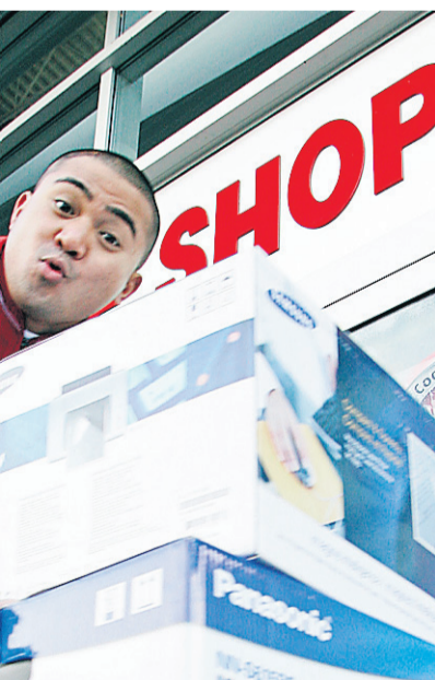
Future Shop mise beaucoup sur les électroménagers.