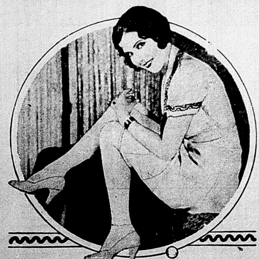
Une de nos admiratrices canadiennes-françaises du hockey, écoutant, assise confortablement sur une banquette, le résultat par la radio de la joute Chicago-Canadien. On remarque par sa physionomie joyeuse qu'elle anticipait la victoire du Bleu Blanc Rouge.