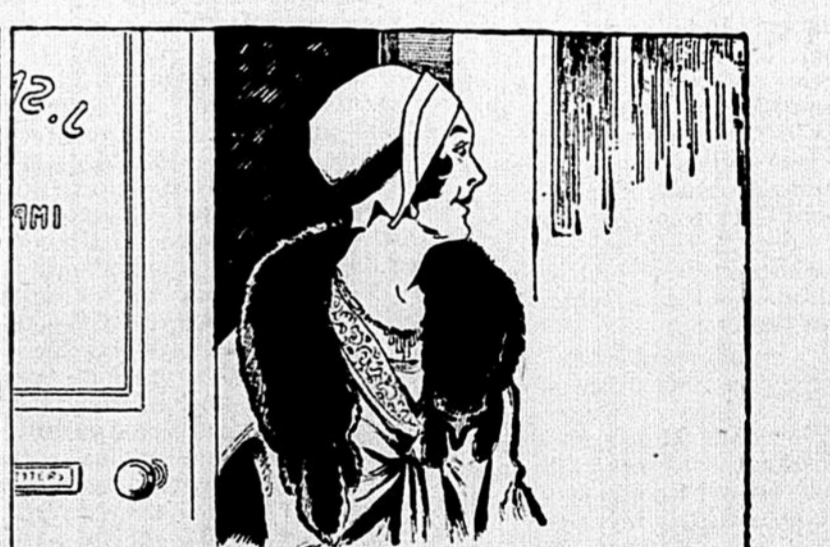
mais la semaine suivante, quand ta moitié te fait une visite inattendue au barcou —