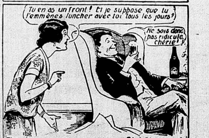
Tas-tu ensuite essayé une BLACK HORSE? Ça aide beaucoup.

dites simplement — "Bière Black Horse Dawes s.v.p.!"