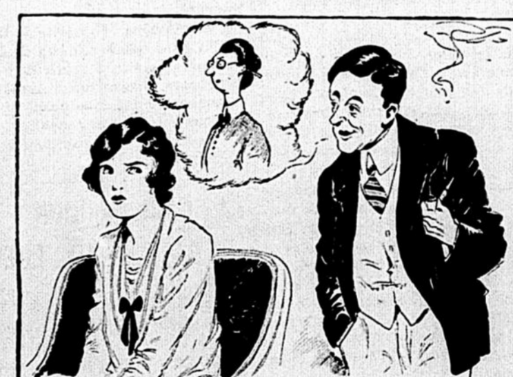
Tas-tu déjà juré à ta femme, un peu jalouse, que la nouvelle sténographe a à peu près l'air de ceci —