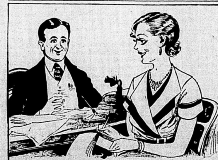
elle aperçoit la jolie blonde que...