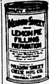
Le produit original et authentique.