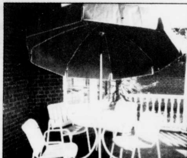
Table 36" au-dessus "Werzelit" résistant (aussi disponible 42") Chaise tubulaire acier pré-peint (3 coloris) Parasol avec... 7½' diamètre

Parasol 7½' ou 8½' diamètre (plusieurs coloris) Table 42" au-dessus "Werzelit" Fauteuil grand luxe tube d'aluminium pré-peint coussin en dacron à l'épreuve des intempéries