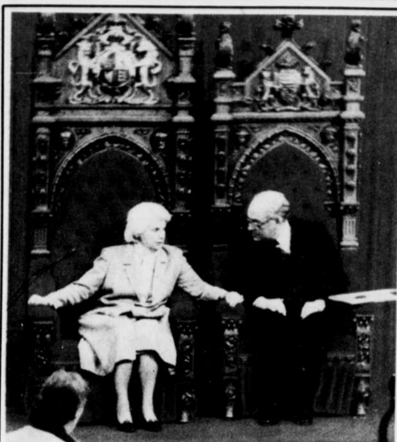
Mme Jeanne Sauvé a participé, accompagnée de son mari, à répétition de la cérémonie qui lui confèrera le titre de Gouverneur général du Canada aujourd'hui.