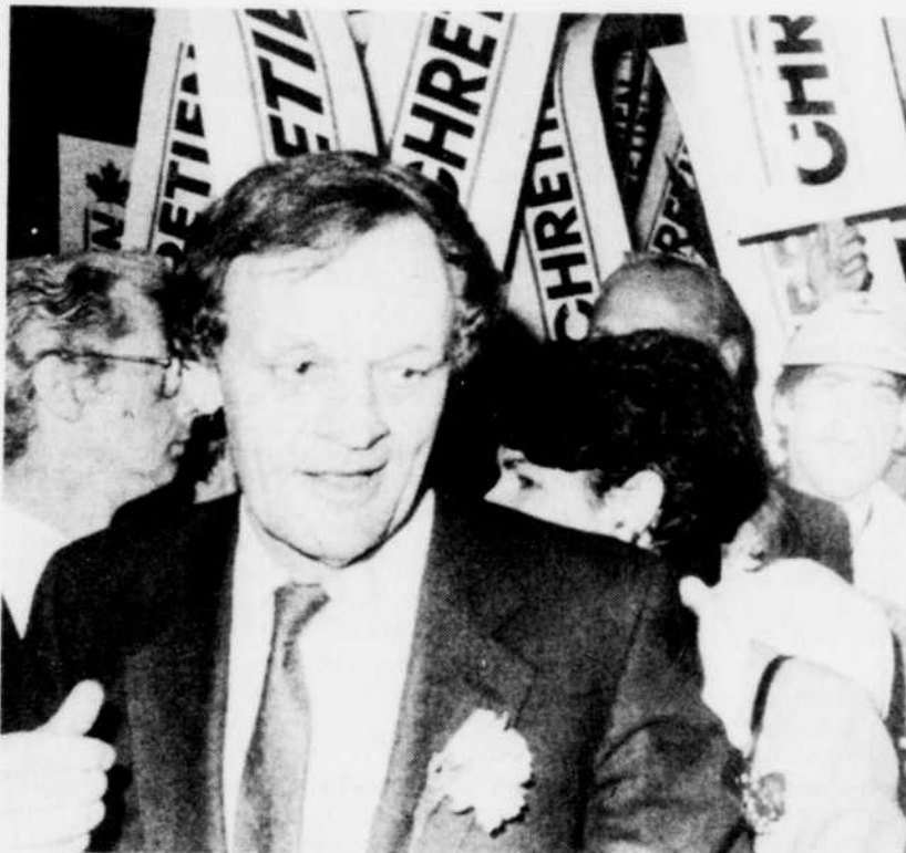
Les partisans de Jean Chretien n'avaient rien ménagé pour montrer que le député de Saint-Maurice arrive en tête dans sa province, du moins selon ses organisateurs.

Pour sa part, Donald Johnston a affiché son optimisme en rappelant que "le bilinguisme fait son chemin à travers le pays".