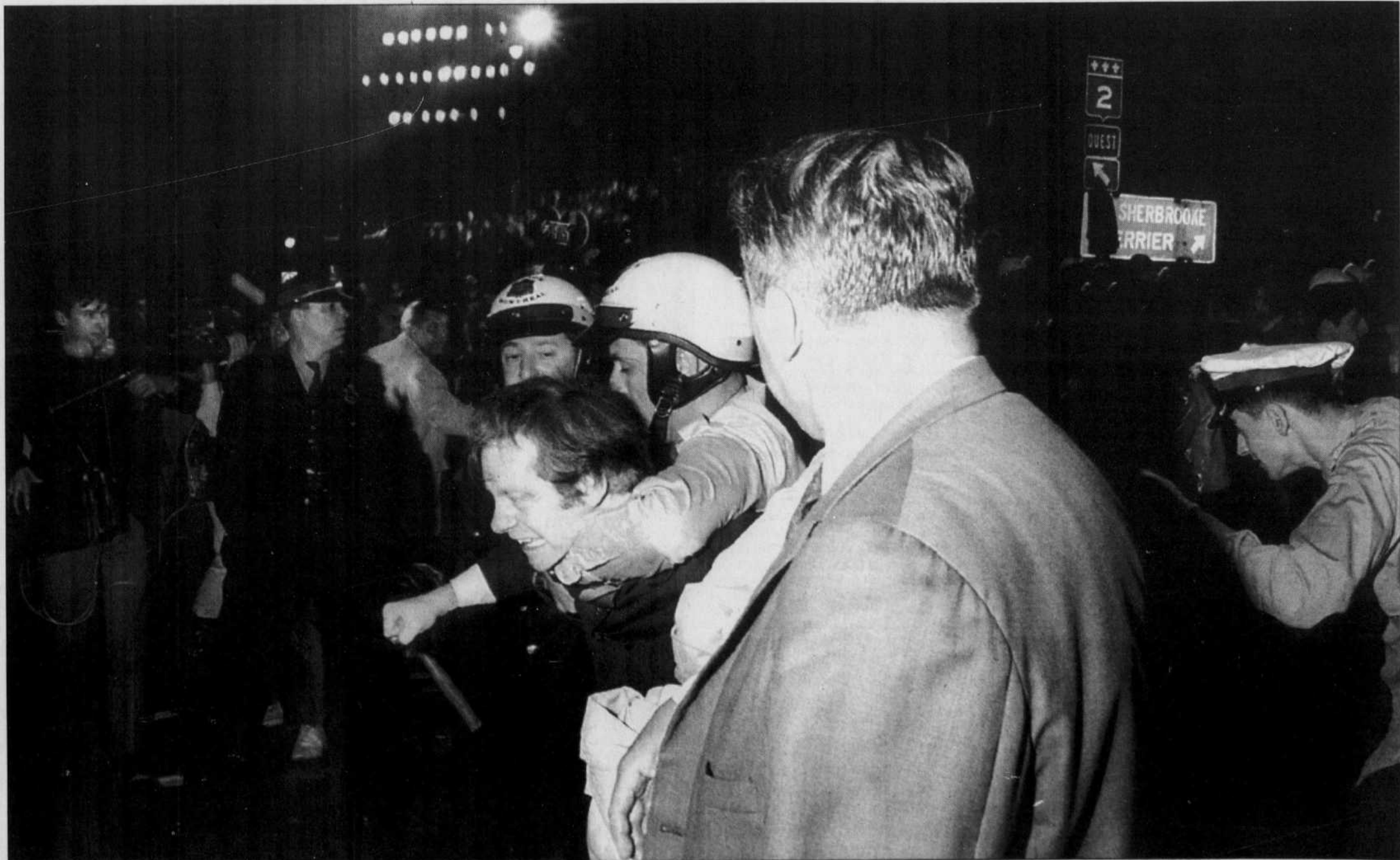
À la Saint-Jean, en 1968, les manifestants dénoncent la présence de Pierre Elliott Trudeau sur l'estrade d'honneur. Bourgault est arrêté. La nuit se solde par 292 arrestations et 123 blessés.