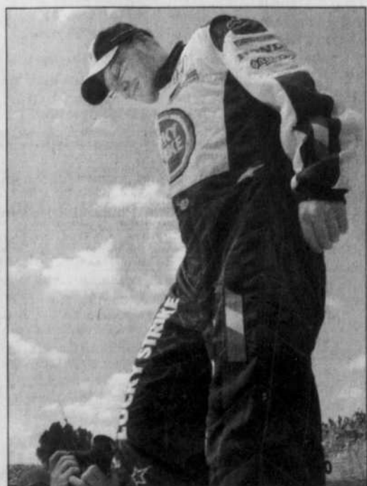
Le titre de champion du monde de Jacques Villeneuve, acquis chez Williams en 1997, paraît désormais lointain.

re tandis que Rubens Barrichello est toujours sous contrat jusqu'à la fin 2004. McLaren entend conserver le duo Raikkonen-David Coulthard, à moins que