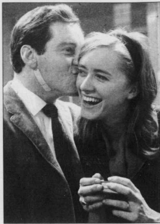
ANTOINE DESILETS, COLLABORATION SPÉCIALE Pierre Bourgault en compagnie de la journaliste Lysiane Gagnon, à l'époque où celle-ci écrivait en faveur de l'indépendance du Québec dans le journal du RIN.