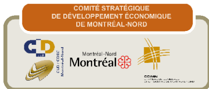
Table Économie et emploi

Le Comité stratégique de développement économique est le résultat d'un partenariat entre le CLD et la CDEC Montréal-Nord, la Chambre de commerce et d'industrie de Montréal-Nord ainsi que l'Arrondissement de Montréal-Nord. À l'intérieur d'une orientation commune, il a comme objectif de susciter une culture de participation, de collaboration et d'efficacité tout en créant une synergie entre les divers intervenants économiques du territoire. Le CSDÉ a continué de veiller à la concertation entre les partenaires du milieu, mais également au bon développement économique du territoire. Afin de mieux répondre à ses objectifs, le comité a entamé des démarches de réalisation d'un plan et d'outils de communication (identité visuelle, cartes, site Web) lui permettant de mieux se positionner en tant que « référence » auprès de tous les intervenants potentiellement intéressés au territoire.