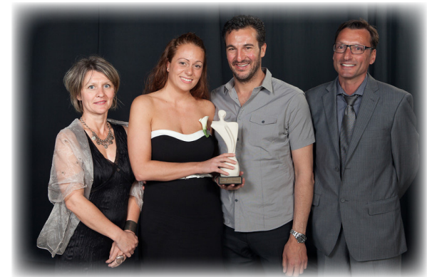
Ci-dessus : Resto-bar Capucine et ci-dessous, Les Manufacturiers Volton.

d'analyse et des documents de présentation. L'adoption de ces outils sert non seulement à améliorer les pratiques internes, mais répond également à certains objectifs du PALÉE 2012-2015 : mieux communiquer l'offre du CLD, bonifier les outils financiers d'intervention, mettre en place des processus internes au CLD, entre autres.