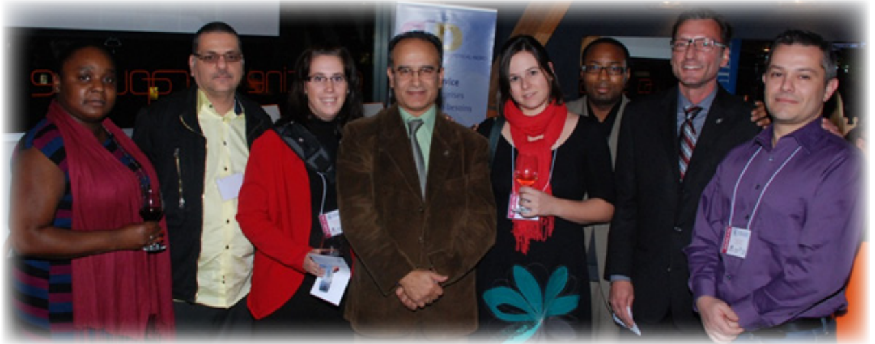
L'équipe du CLD lors de la soirée de clôture de 4 MN 2012