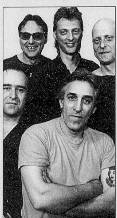
Le groupe Corbach.