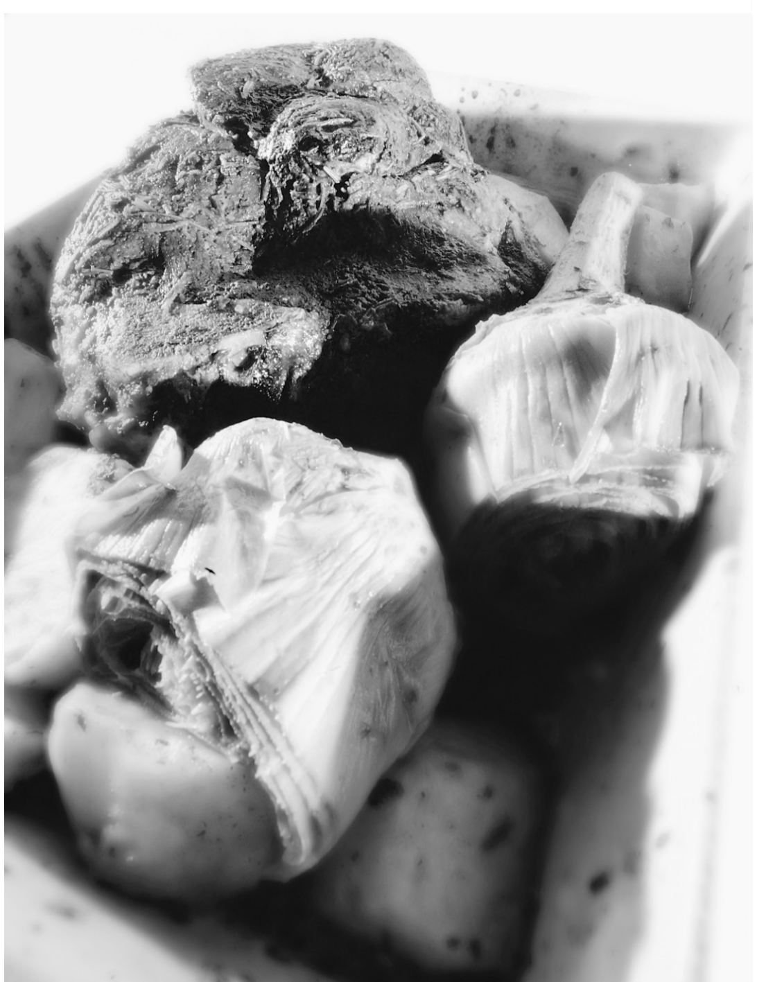
Agneau pascal rôti aux pommes de terre et aux artichauts

1- Pour la farce, faites blanchir les épinards dans de l'eau bien salée (une à deux minutes), rincez à l'eau froide et essorez bien. Hachez finement. Faites chauffer de l'huile d'olive dans un poêlon et faites sauter les champignons à feu élevé pendant trois minutes. Ajoutez le gingembre et l'ail, 1 c. à thé de sel environ, du poivre au goût, et laissez cuire encore un autre trois minutes à feu moyen. Ajoutez 1 c. à thé de curry, le zeste de ci-