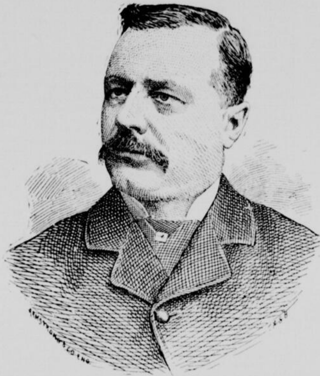
GEORGES-HONORÉ DESCHENES DÉPUTÉ (CONSERVATEUR) DU COMTÉ DE TÉMISCOUATA

La ligne, par insertion . . . . . 10 cents Insertions subséquentes . . . . . 5 cents Tarif spécial pour annonces à long terme