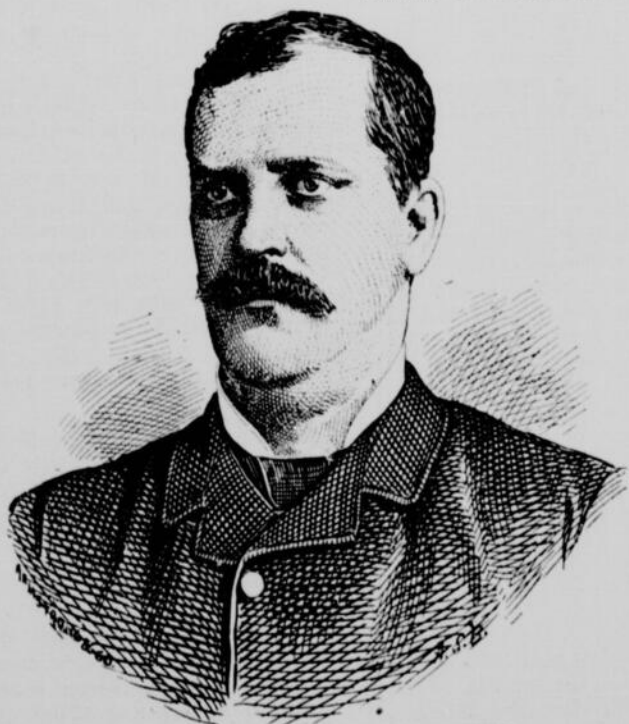
ÉDOUARD-HYPOLITE LALIBERTE DÉPUTÉ (LIBÉRAL) DU COMTÉ DE LOTBINIÈRE