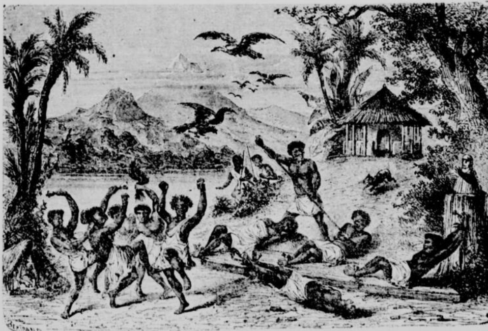
Sacrifices humains au Dieu de la guerre.—(Page 14, col. 2).

On n'entendait que le tam-tam. Une centaine