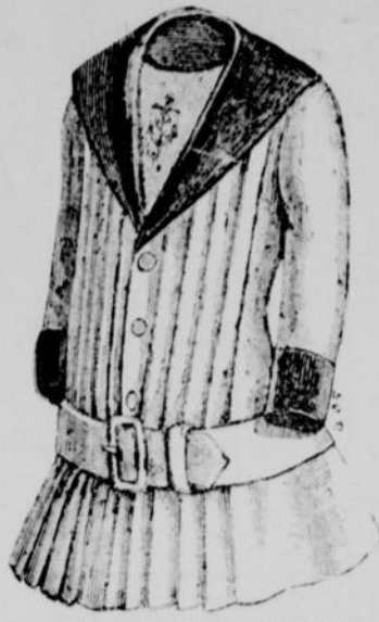
Pour petit garçon de 3 à 5 ans, (devant)

MANTEAU ANDRIAS. —Ce joli manteau est fait, en drap beige garni de peluche bleu-électrique, col marin et parement gilet plat, avec ancre-brodée bleu-électrique, boutons et boucle de vieil argent.