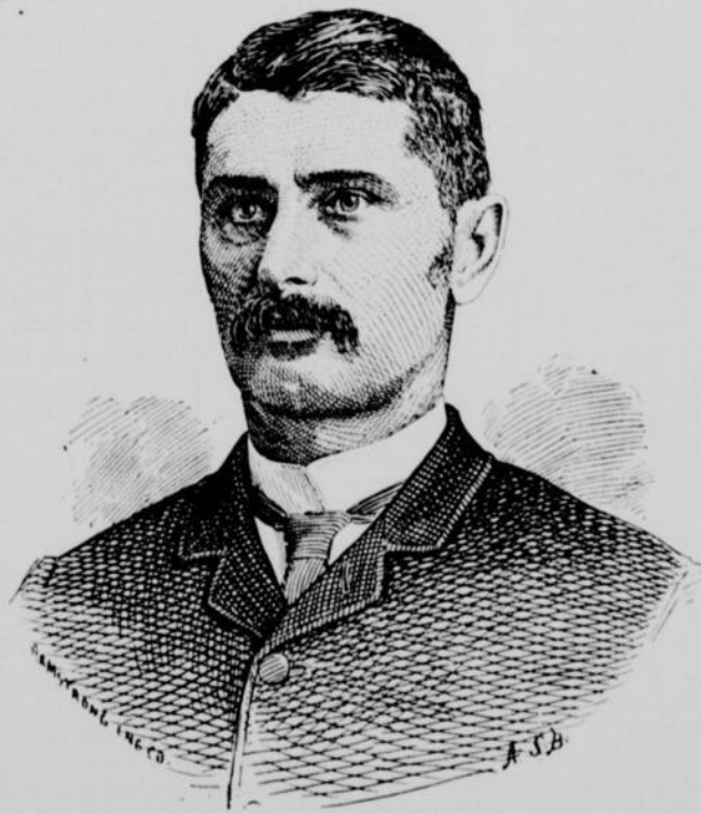
BENJAMIN BEAUCHAMP DÉPUTÉ (NATIONAL) DU COMTÉ DES DEUX-MONTAGNES