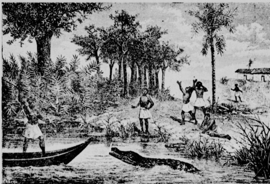
Esclave Houssa voulant tuer le Caïman Fétiche.—(Page 14, col. 1).

Le Haoussa passe comme un trait au milieu des femmes en criant : "Allah kbar, Dieu est grand," et entre dans une pirogue. Les adoratrices de la divinité aquatique, devinant son dessein, joignent les mains au dessus de la tête et s'écrient d'un air consterné : "Ye ! ye ! Oricha, ô, ma kpa, ô, Ye ! ye ! C'est le fétiche, ne le tue