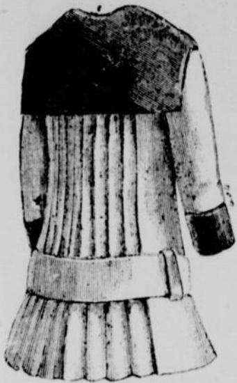
Manteau Andrias (dos)