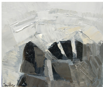
Écho d'un monde, huile sur toile, 2009, 14 x 14, pouces

Muriel Faille développe une poïétique qui met en jeu trois dimensions inhérentes à l'expression plastique: celle des cycles, celle des correspondances et celle des matériaux. C'est ainsi que l'on peut saisir les pôles noir et blanc de cet ensemble d'œuvres d'où la couleur s'est évadée pour mieux laisser place et sens aux valeurs tonales à forte charge symbolique. [...]