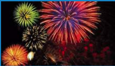
Feux d'artifices IGA EXTRA Thibeau