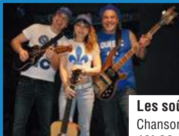
Les souî-liés Chansonniers Québécois 19h00