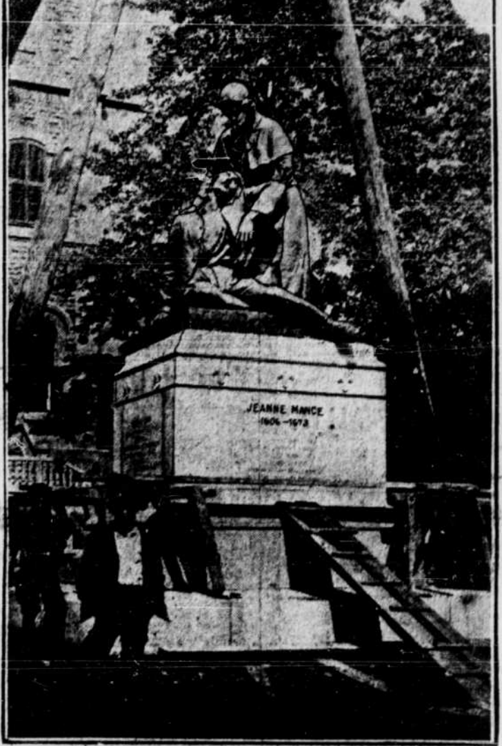
La statue de Jeanne Mance, que l'on a installée sur son piédestal, aujourd'hui, dans la cour de l'hôtel-Dieu. Nos lecteurs se souviennent que cette statue sera dévoilée solennellement, le jeudi, 2 septembre, pendant les fêtes du 250ième anniversaire de la fondation de l'hôtel-Dieu.