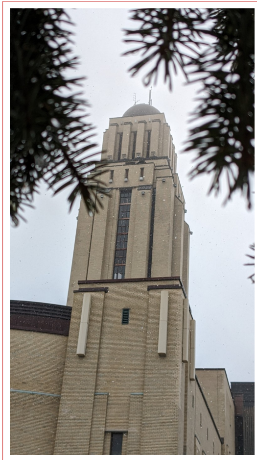
La tour de l'Université de Montréal

Je nous souhaite, collectivement, de nous élever au-dessus des idéologies par les sciences, le savoir et l'éducation. Le Monde en a besoin.