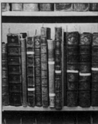
Le livre ancien, un trésor...

Le grand public pourra s'en rendre compte puisque plusieurs de ces livres sont actuellement exposés dans la bibliothèque de la faculté de droit de l'université. «Nous soulignons ainsi un double anniversaire: le 200 e du Code civil français et le 10 e du même Code, version québécoise. Détail intéressant: nous nous sommes efforcés de rendre cette exposition aussi conviviale que possible en accompagnant les livres de légendes compréhensibles pour le commun des mortels. Car on sait que les juristes, toutes époques