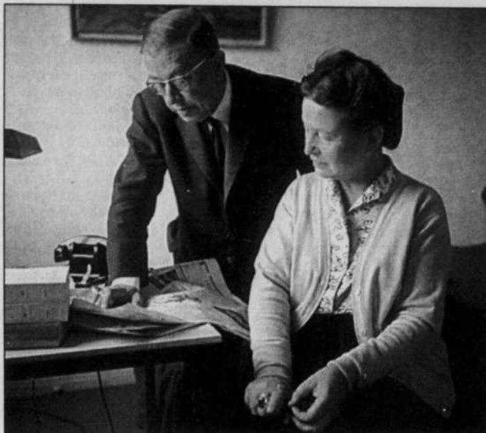
Jean-Paul Sartre et Simone de Beauvoir.

Du moins les choses sont-elles allées ainsi, en France, jusqu'à la mort de Sartre. Un chef d'État, Giscard d'Estaing, se rend à l'enterrement de l'écrivain hors pair. Mais cette disparition laisse l'institution littéraire sans successeur: «Il n'y a pas de Sartre vivant pour écrire de Sartre mort comme il avait pu écrire de ses pairs, de Gide, de Nizan, de