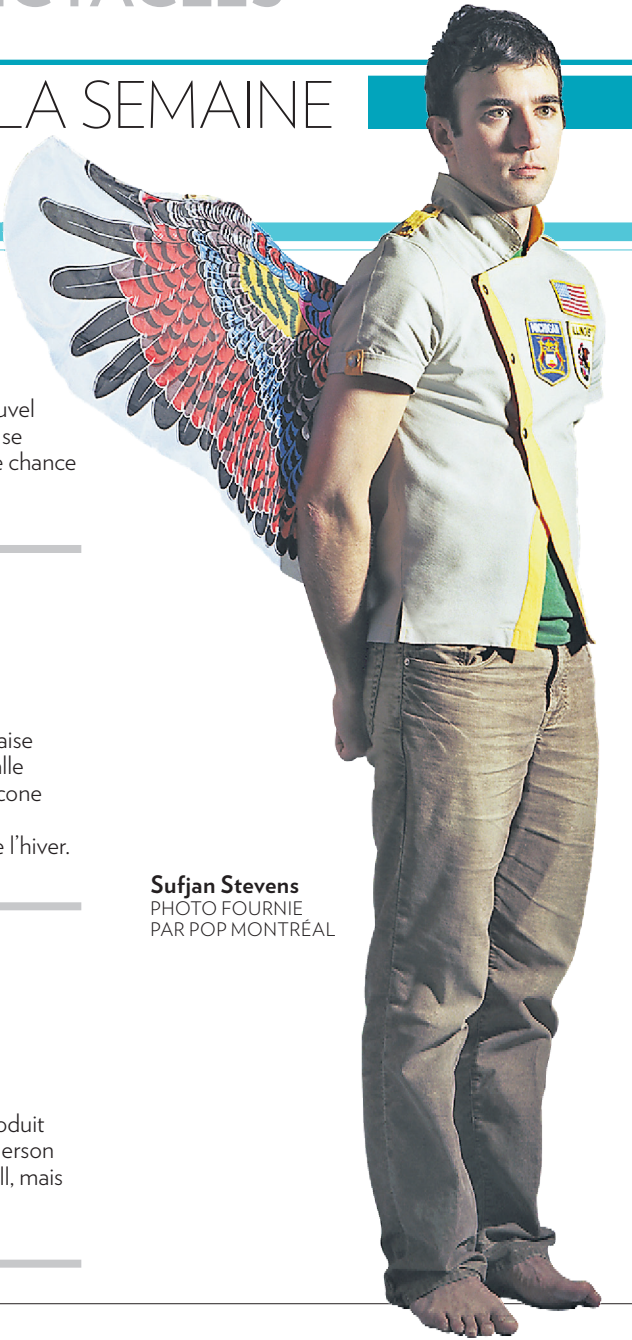
Sufjan Stevens

Le chanteur et flûtiste de la légendaire formation progressive Jethro Tull se produit jeudi soir au Théâtre St-Denis. Ian Anderson interprétera des chansons de Jethro Tull, mais aussi de son répertoire solo. Jeudi, au Théâtre St-Denis