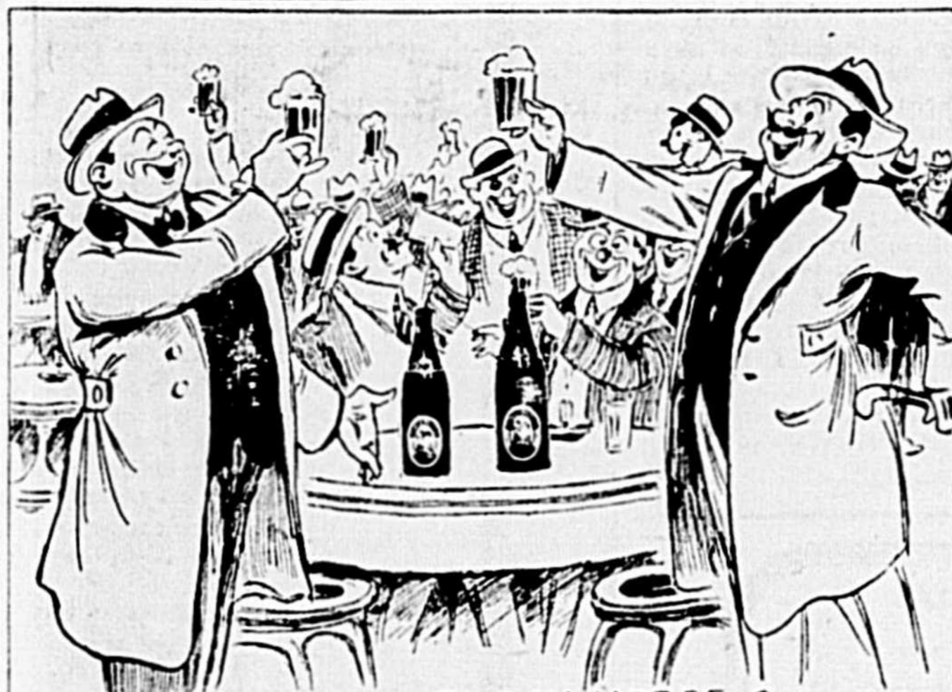
T'as pas essayé une BLACK HORSE ? Ça met tout le monde d'accord —