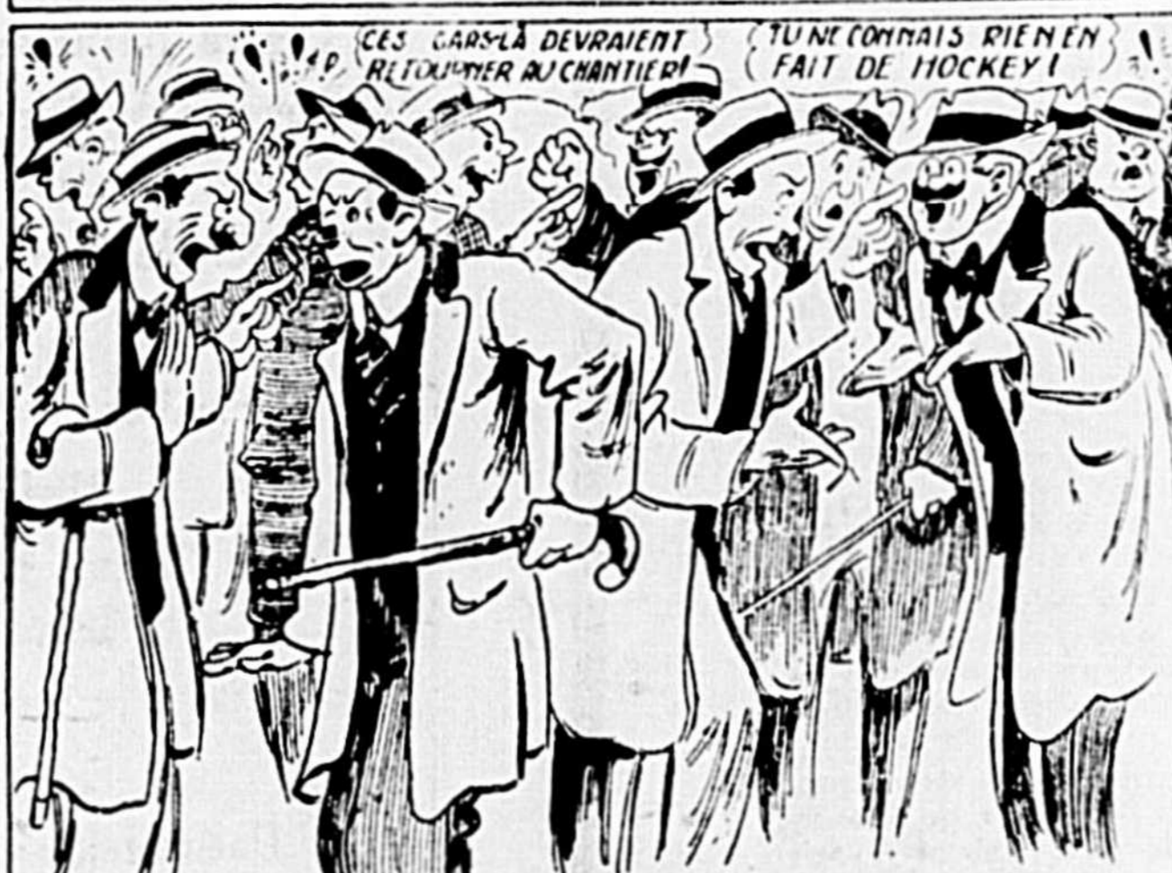
Mais lorsque la partie commence, les discussions reprennent comme dans les bonnes années —