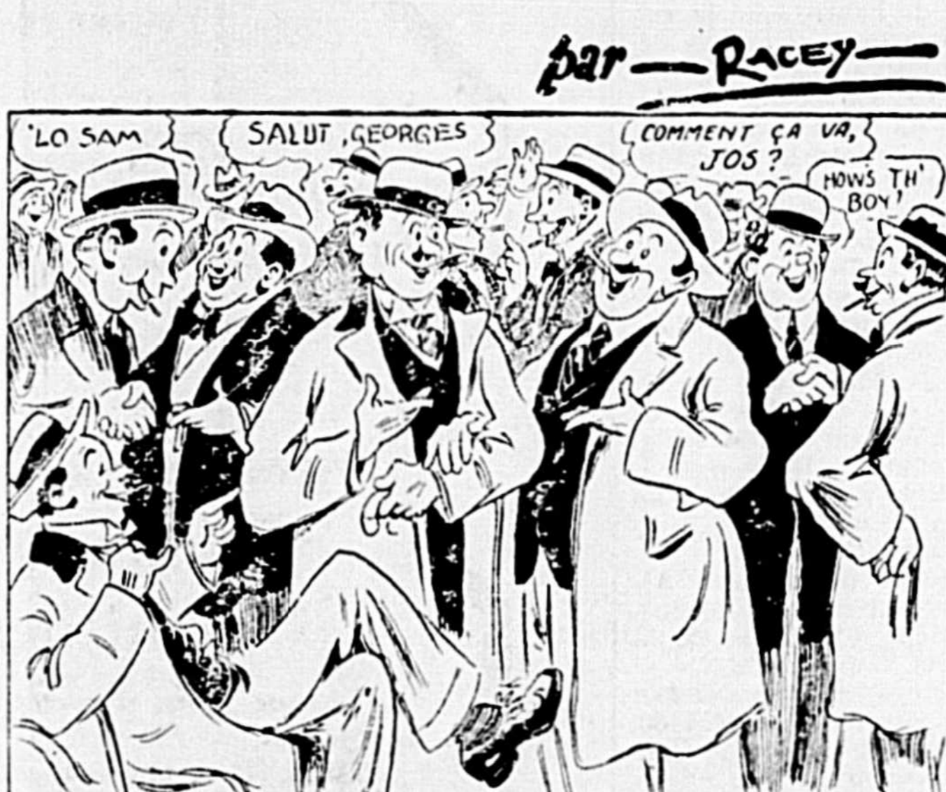
Tout le monde est content de se revoir et l'on échange salutations et poignées de mains —