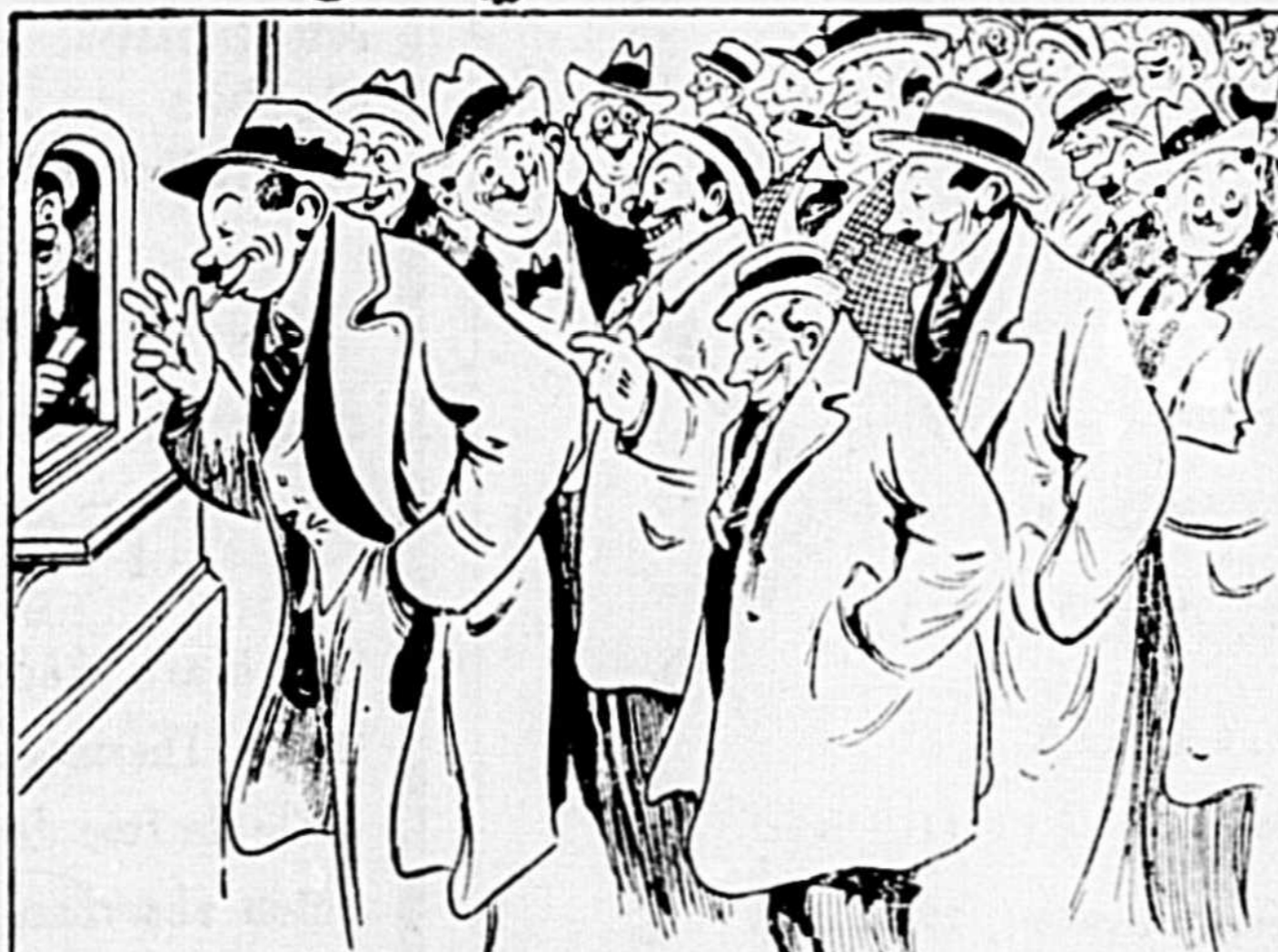
T'as pas déjà rencontré un tas de vieilles connaissances à une première partie de hockey de la saison