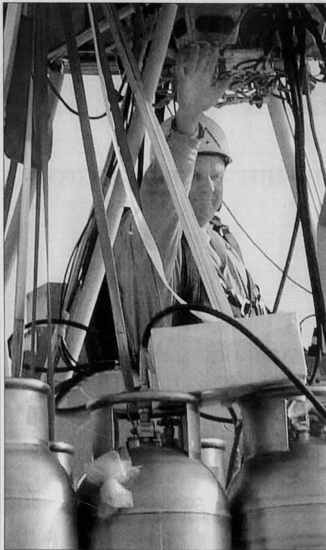
À SA SIXIÈME TENTATIVE, l'aventurier et milliardaire américain Steve Fossett est finalement devenu hier le premier homme à réussir un tour du monde en solitaire en ballon. L'aérostatier a parcouru 31 266 kilomètres autour du globe en 13 jours, 12 heures, 16 minutes et 14 secondes. Sa nacelle, le Spirit of Freedom («Esprit de liberté»), sera exposée à Washington aux côtés du Spirit of Saint Louis, l'avion de Charles Lindbergh qui traversa le premier l'Atlantique en solitaire.