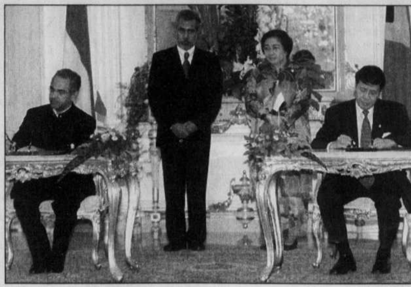
Normalisation des relations diplomatiques.

Megawati et son mari ont accueilli avec un grand sourire Gusmao, qui a passé sept ans dans une prison de Jakarta pour avoir pris les armes. Le nouveau chef de l'Etat du Timor est arrivé accompagné de son épouse enceinte sur le perron du palais présidentiel de Jakarta, orné des drapeaux des deux pays.