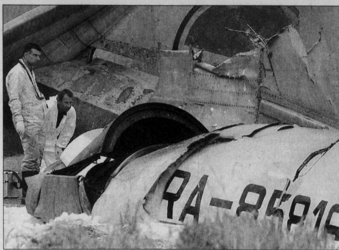
Des enquêteurs de la police allemande inspectent le Tupolev russe qui s'est écrasé à la suite d'une collision en plein ciel avec un appareil cargo, un Boeing. Soixante et onze personnes sont mortes.