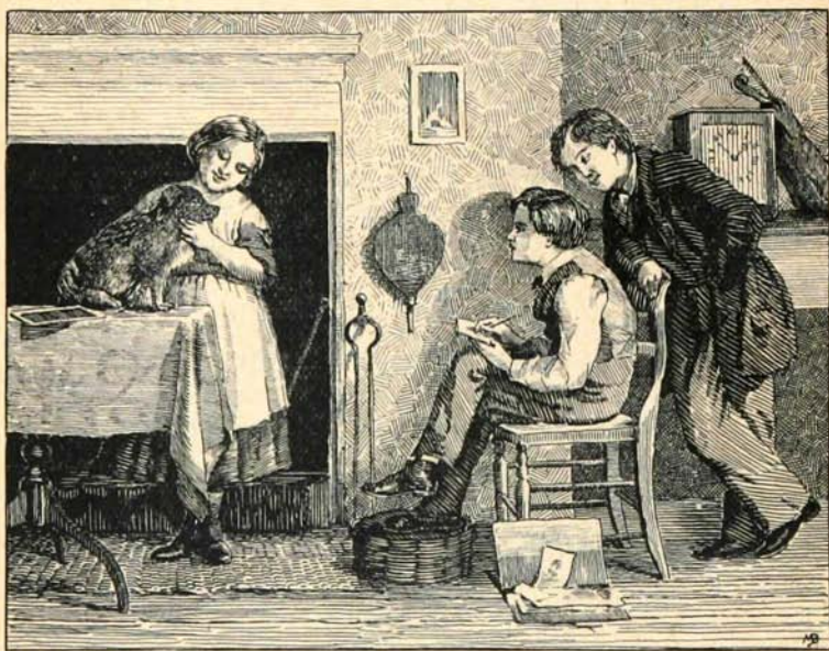
UN ARTISTE EN HERBE

256. — ... Avec un travail soutenu, vous garderez en classe la place qui vous revient de droit, la première. (On s'adresse à un élève plus âgé que ses camarades ; commencer par une phrase interrogative.)