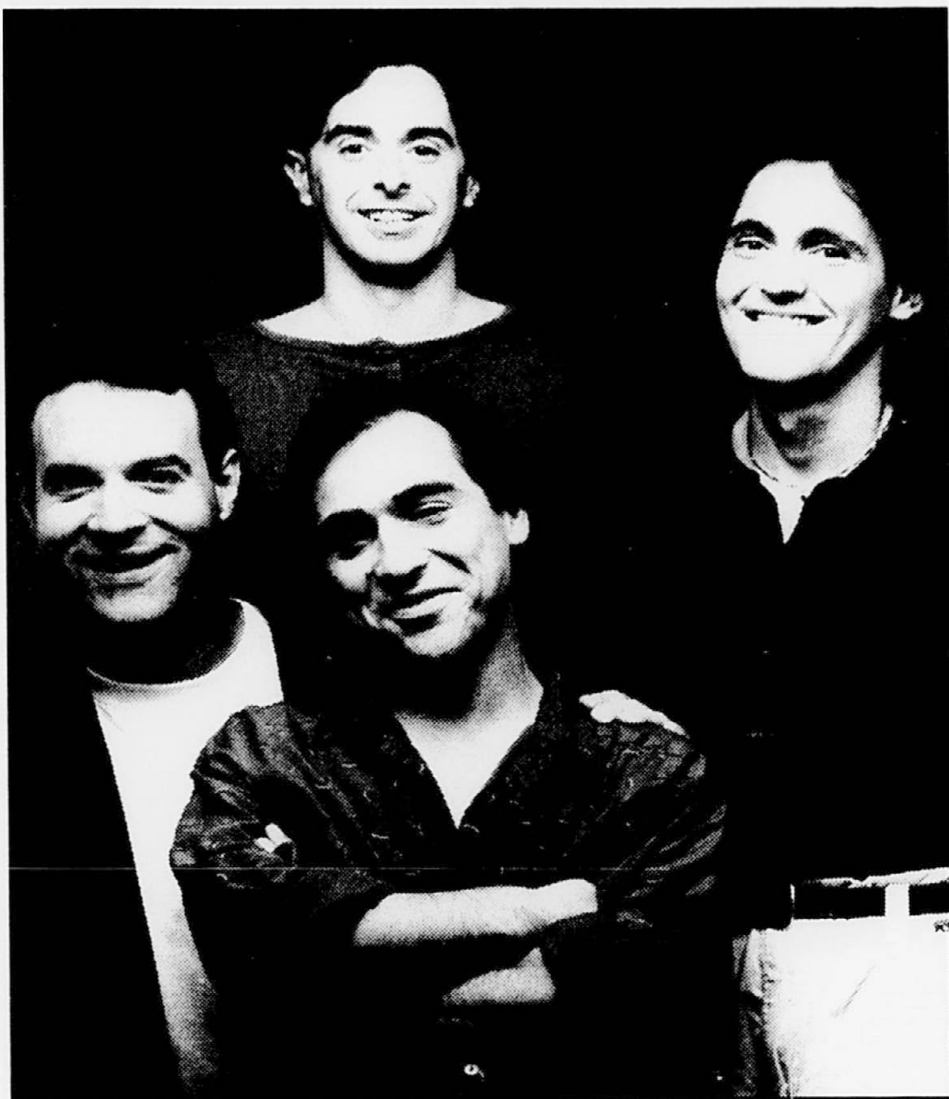
Rock et Belles Oreilles: Bruno Landry (à gauche), André Ducharme (en bas), Yves Pelletier et Guy A. Lepage.

«L'émission a été très amusante à faire. J'étais un peu surpris. J'ai beaucoup aimé faire ça. Ça faisait deux ans que, à part le gala de l'ADISQ, on n'avait pas fait de choses devant le public (Depuis le spectacle Bêtes de scène ,