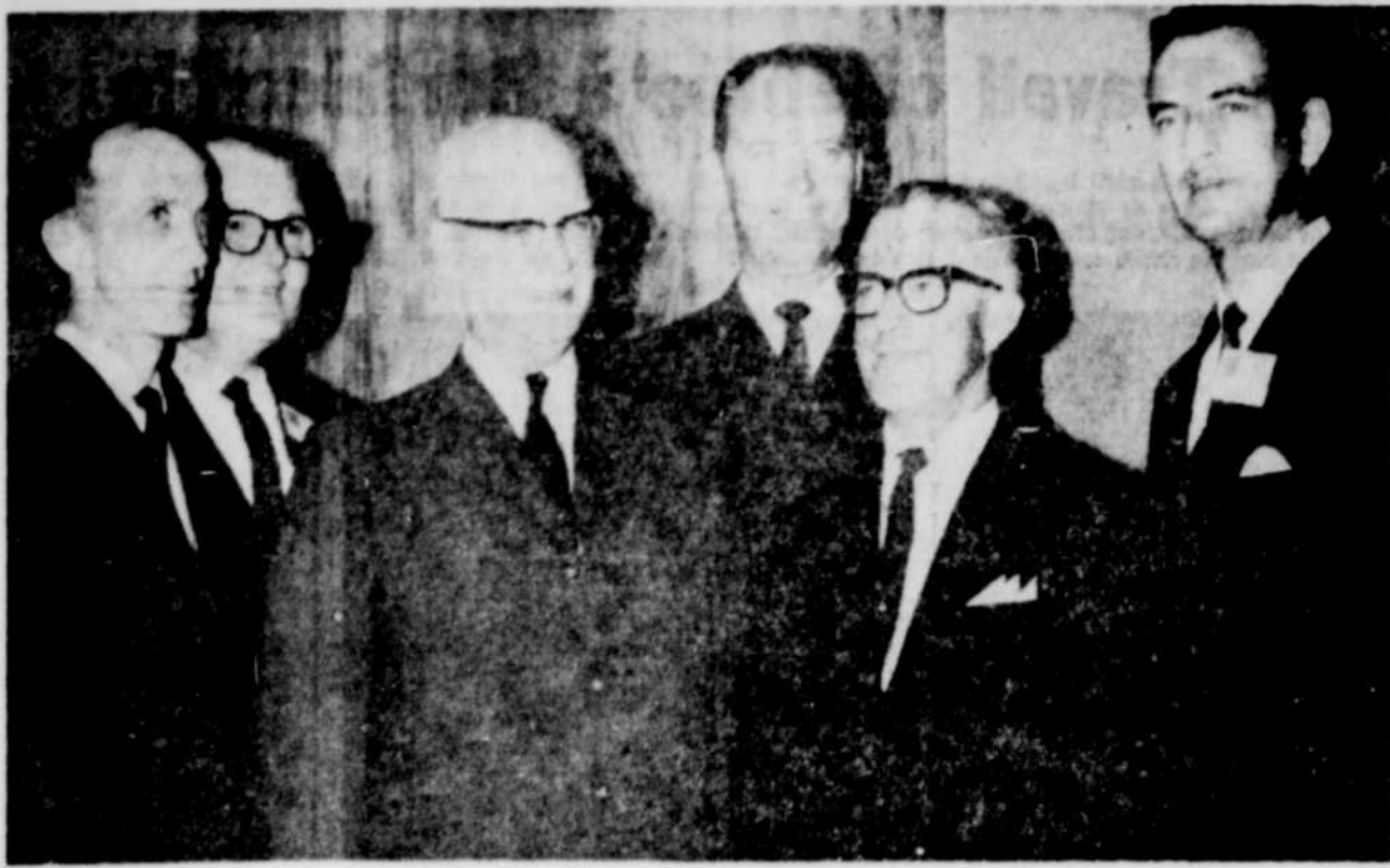
LES MEILLEURS REPRESENTANTS des régions canadiennes et américaines de la Société des Artisans, membres du Club des Vedettes, participent actuellement à un congrès tenu à l'Estérel, dans les Laurentides. Accompagnés de leurs épouses, ces 57 experts en assurance coopérative étudient divers aspects de la compétence professionnelle