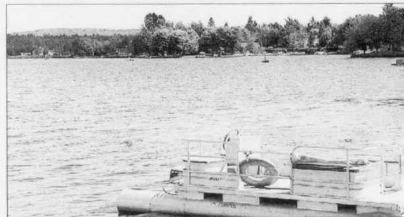
Lorsque le problème du lac aura été réglé, la construction de résidences pourra continuer.