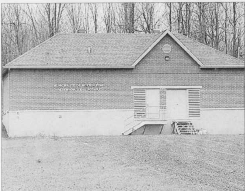
Les travaux d'aqueduc et d'égout sont presque complétés à Roxton Pond, 75 % des citoyens sont maintenant branchés aux réseaux.

Toujours dans le domaine des ententes, Raymond Loignon est sa-