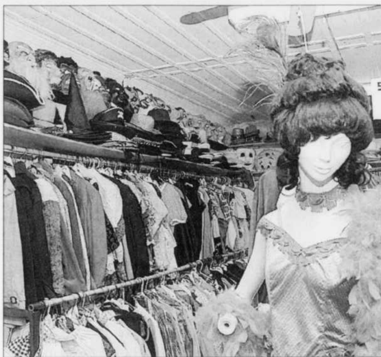
Au grenier de Pierrot, on trouve 1000 costumes dont 700 sont destinés aux adultes.

« Mon rêve serait maintenant de pouvoir vivre toute l'année avec mon commerce et de travailler à temps plein ici en ayant aussi des contrats pour des demandes spéciales. Je travaille présentement pour une couturière, mais j'aimerais pouvoir me consacrer uniquement Au grenier de Pierrot. J'ai 38 ans et pour moi, ce commerce représente mon avenir. Si j'ai appris à coudre par obligation, maintenant, c'est une vraie passion pour moi! »