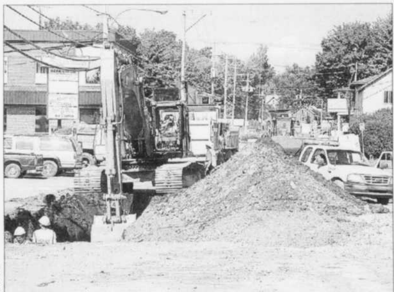
Une grande partie du réseau routier, principalement celui qui touche le cœur du village, a été refait depuis un an.

2A LA VOIX DE L'EST - CAHIER SPÉCIAL - MARDI 14 NOVEMBRE 2006