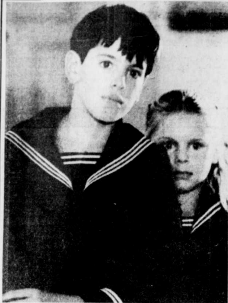
Les cinéphiles intéressés à acquérir des classiques comme Bergman ou Hitchcock doivent s'attendre à certaines anomalies du marché. Ainsi la version française du film "Fanny et Alexandre" (notre photo) coûtera plus chère que la version anglaise.