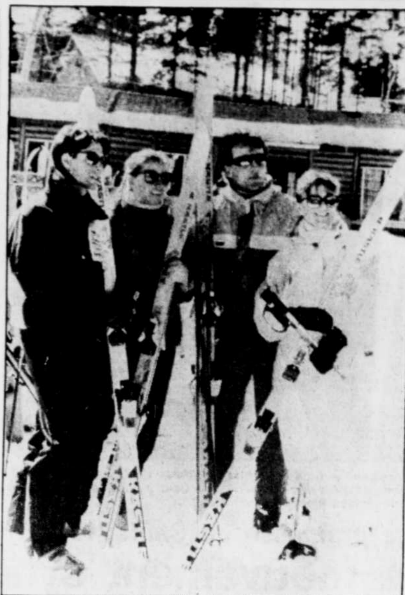
Comme les pistes de ski alpin, les sentiers de ski de fond offraient une surface de belle neige sur laquelle on glissait aisément, et non la glace que l'on retrouve dans la plupart des autres centres de ski.