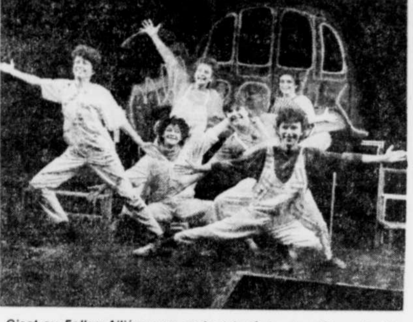
C'est au Folles Alliées que revient la tâche de clôturer le 10e Festival des Filles des Vues.

17h: Pure virtue. Réalisé par Tanya Mars. Fiction. Canada 1985. Rapport entre les femmes et le pouvoir. * Première à Québec. 17h: Pécadillos. Réalisé par Yvonne Dignard. Experimental. Canada 1986. Sujet: le voyeurisme. * Première à Québec, en présence de la réalisatrice. 17h: Ecstasy unlimited: the interpenetrations of sex and capital. Réalisé par Laura Kipnus. U.S.A. 1986. Les 2 catégories de