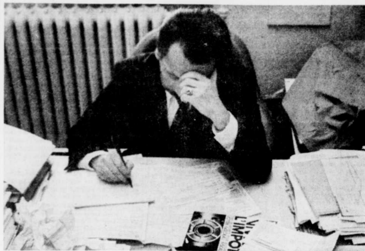
C'est en 1917 que le gouvernement fédéral instituait ses premiers impôts. Aujourd'hui, les impôts sont toujours là et ils se sont drolement compliqués au fil des ans.

Au 14 e siècle, la ville de Dijon, en France, créa une taxe sans précédent: les citoyens, qui fai-