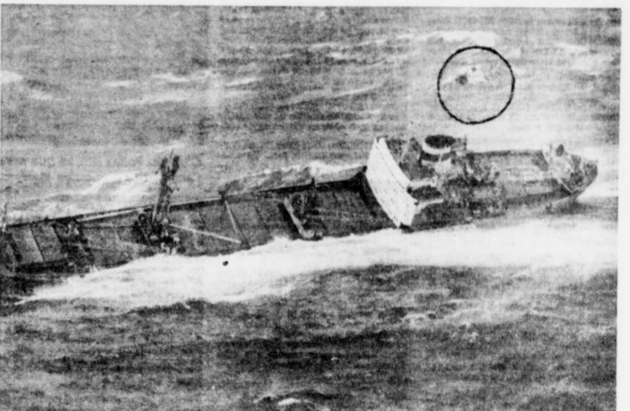
Un des hélicoptères utilisés pour l'opération de sauvetage survole le cargo. Hier soir, le navire abandonné donnait encore plus de la bande mais n'avait pas encore sombré. Si la mer est moins démontée aujourd'hui, des efforts seront tentés pour le sauver.

Après avoir dénoncé "les crimes" perpétrés par ce pays contre le Tchad, l'Afrique, la Nouvelle-Calédonie, le Liban, l'Iran et la Palestine, l'OJR affirme qu'elle était parvenue "à des accords et à des engagements qui avaient commencé à être appliqués, mais malheureusement la France continue de rêver qu'elle est une grande puissance et qu'elle peut maintenir sa tutelle sur ses anciennes colonies."