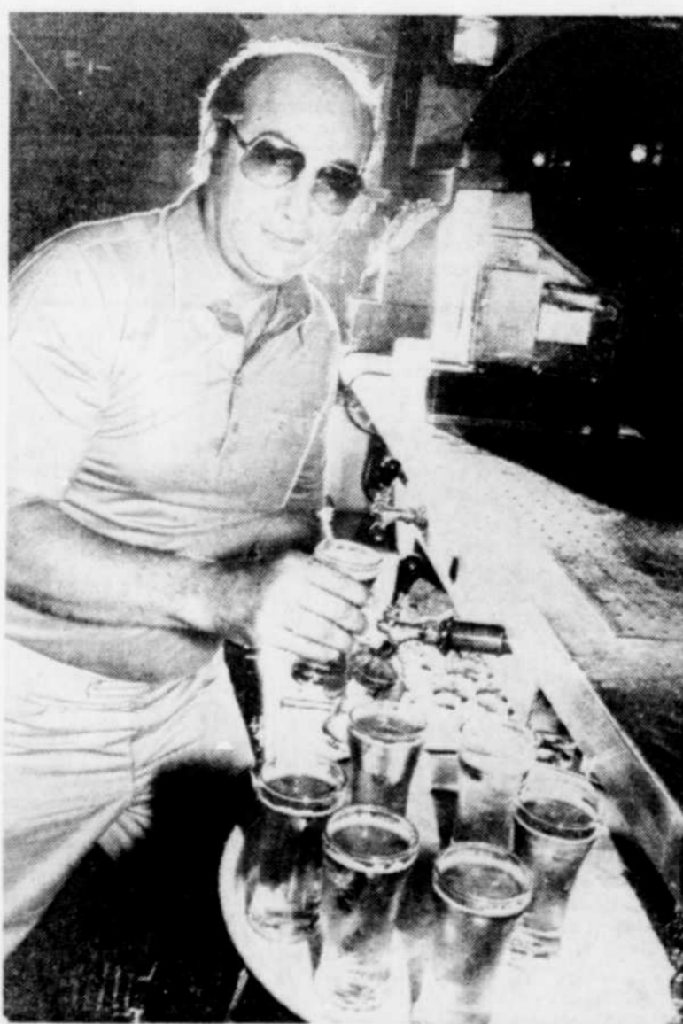
Les brasseries réalisent des profits bruts de 47,4 pour 100 contre 25,7 pour 100 dans la boulangerie-pâtisserie.

♦ La marge bénéficiaire brute que les brasseries, les distilleries et les fabricants de tabacs réalisent au Canada est nettement plus importante que le profit brut obtenu dans les secteurs de la boulangerie, de la transformation des produits laitiers, des fruits et légumes ou les poissons.