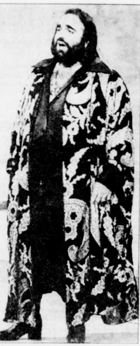
Demis Roussos AVANT

Si vous renvoyez le bon ci-contre avant 5 jours, vous recevrez en plus un petit cadeau qui vous aidera à maigrir encore plus facilement. UNE SURPRISE!