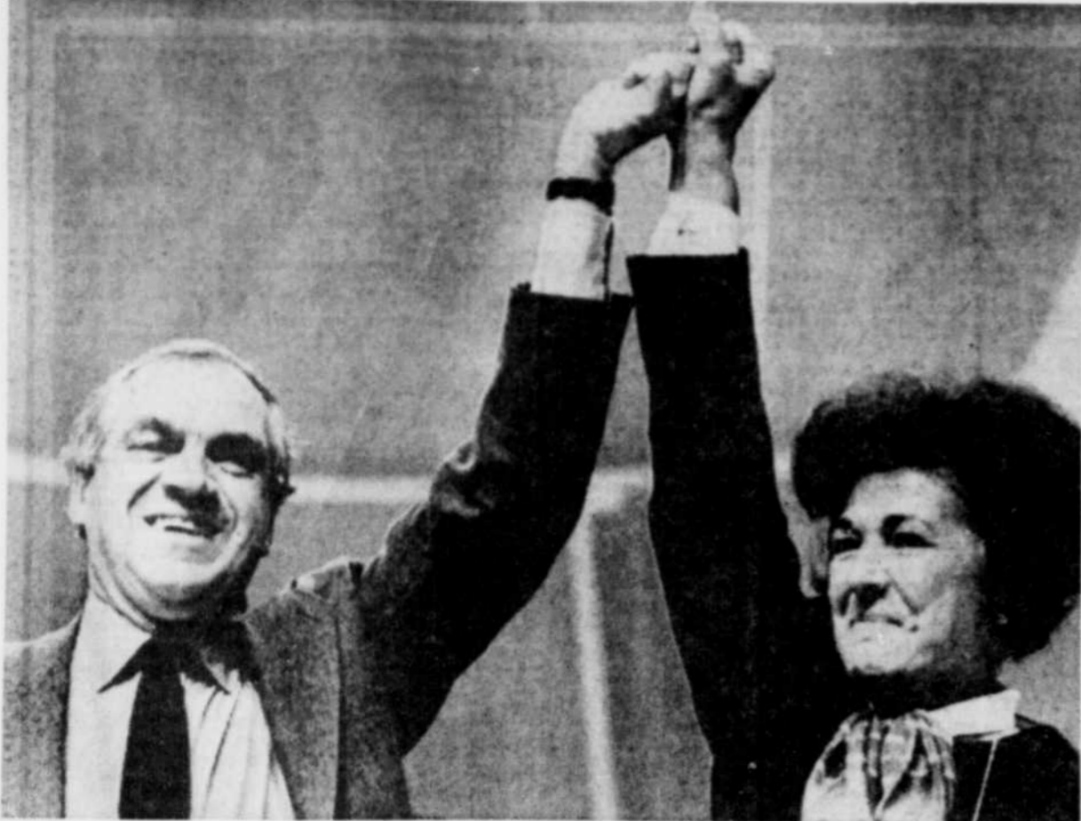
Ed Broadbent et Shirley Carr, la présidente du Congrès du travail du Canada. Dans son discours aux congressistes néo-démocrates, celle-ci a pris l'engagement de donner son appui au NPD, lors des prochaines élections fédérales.