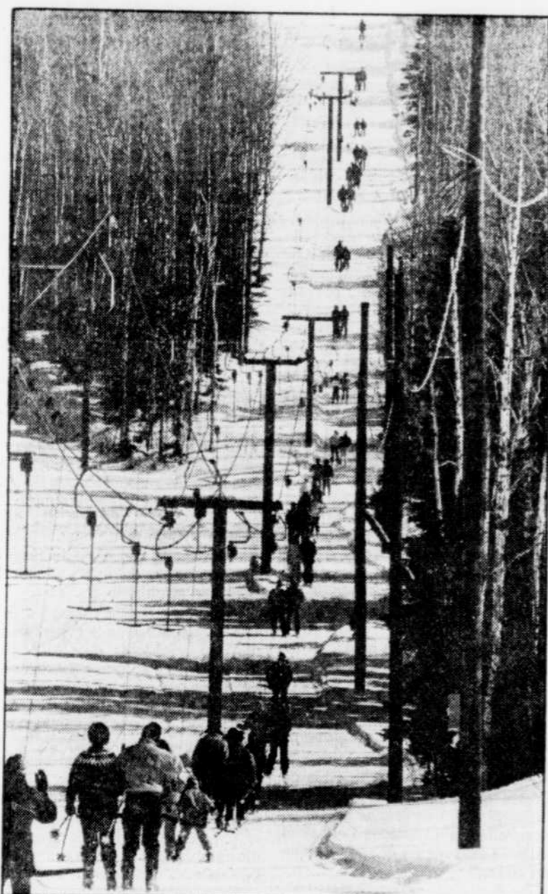
Les skieurs sont repartis hier matin à l'assaut du mont Grand-Fonds, intouché depuis deux mois et demi. Seuls venaient y glisser les résidents du coin, avec leur petite famille.