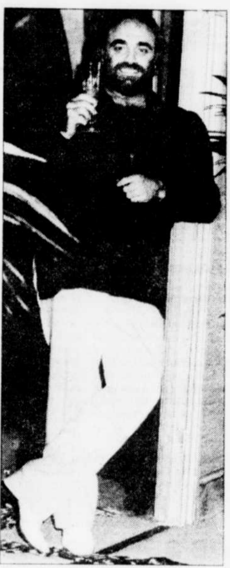
Demis Roussos AUJOURD'HUI

Vous plairez davantage. Une nouvelle vie commencera pour vous.