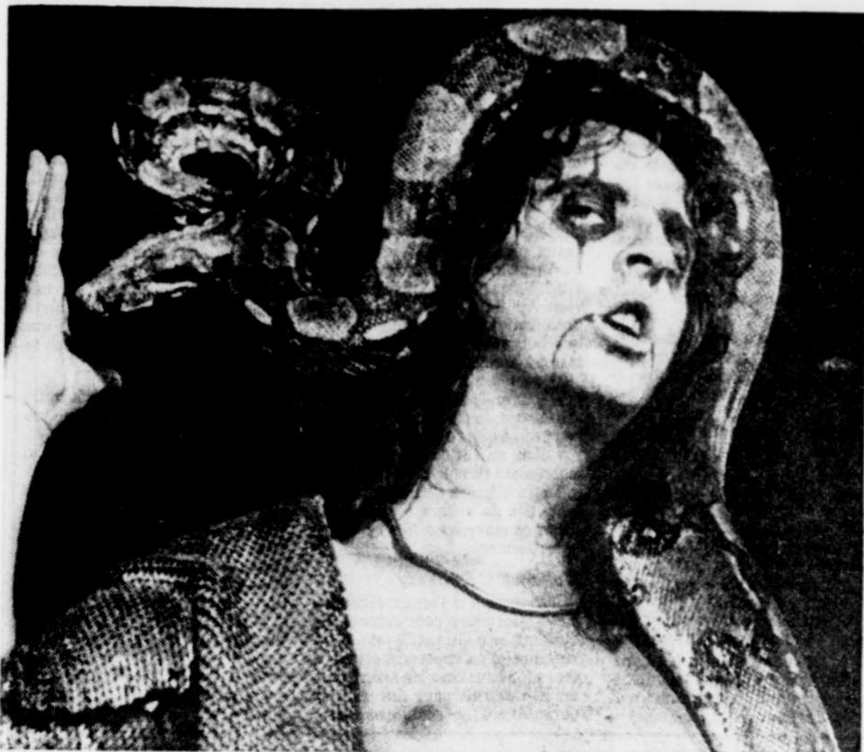
Le boa constrictor est en quelque sorte la marque de commerce d'Alice Cooper. Un boa qu'il traîne d'ailleurs dans ses spectacles et qui rappelle le titre de son dernier microsillon "Constrictor".

Après quatre années d'absence, pendant lesquelles il a préparé son retour, Alice Cooper est aujourd'hui fermement décidé à reprendre sa place sur la scène musicale. Constrictor , un nouveau microsillon, a été lancé il y a quelques mois et le chanteur est en tournée depuis octobre dernier.