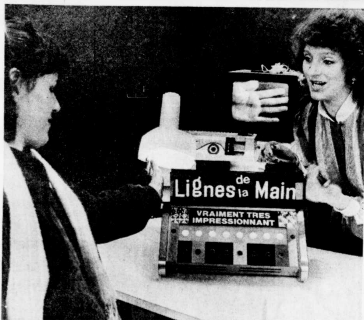
Au Salon de la femme, un organisme de charité et un centre de prières côtoient les cartomanciens, qui avec la boule de cristal ou l'ordinateur vous prédisent l'avenir.