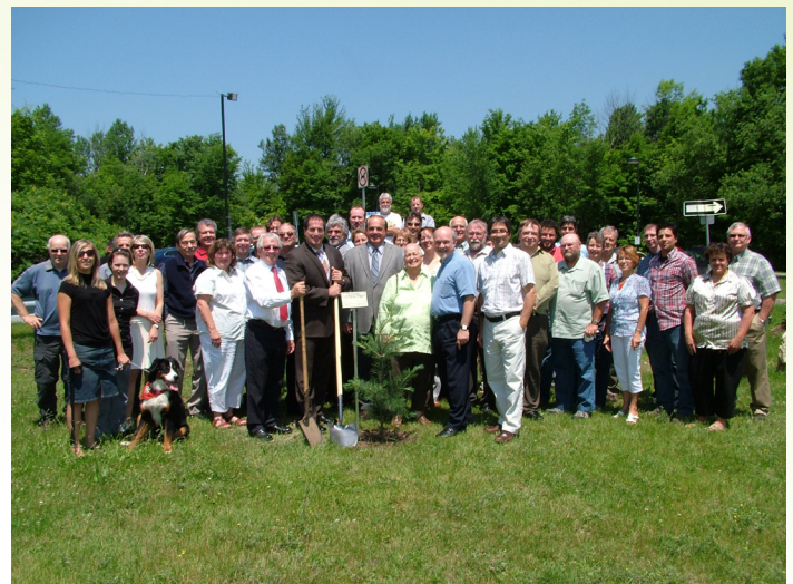
Forum annuel de la CRRNTO 17 juin 2010 Plantation d'un arbre pour souligner le centenaire de l'enseignement de la foresterie au Québec

Bien que la gestion financière de ce programme relève du MRNF, les modalités du programme prévoient tout de même que la liste des projets sélectionnés soit adoptée par la CRÉO. Ainsi, le 6 décembre 2010, le conseil d'administration de la CRÉO a donné le feu vert à 4 projets pour une valeur totale de subvention de 25 000 $.