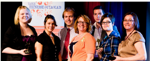
Lauréats du Concours en entrepreneuriat social 2011