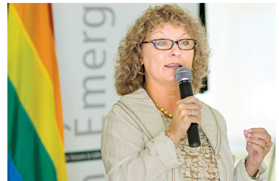
La ministre de la Famille et des Aînés, Marguerite Blais

ministre de la Santé et des Services sociaux, Yves Bolduc, a visité la salle et rencontré le personnel hier, une salle pour laquelle il a versé 2,3 millions de dollars. L'institut lui-même et sa fondation ont aussi apporté leur contribution. L'électrophysiologie est une branche de la médecine cardiaque qui s'occupe plus spécifiquement des problèmes du rythme cardiaque. La nouvelle salle permettra de procéder à des interventions comme l'implantation de défibrillateurs cardiaques, l'implantation de stimulateurs cardiaques et diverses ablations. Elle abrite des équipements comme de l'imagerie qui reconstruit les structures du cœur en temps réel, un appareil de cartographie en 3D, un appareil qui permet de faire une échographie à l'intérieur du cœur et une console de cryothérapie qui permet de s'attaquer aux courts-circuits électriques du cœur par la chaleur ou le froid. — La Presse canadienne