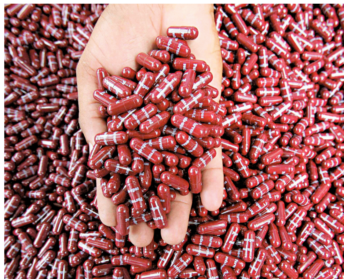
Le quotidien La Presse rapportait, dans son édition d'hier, qu'il y a eu 116 épisodes de rupture de stock de médicaments l'an dernier, contre 38 en 2008.