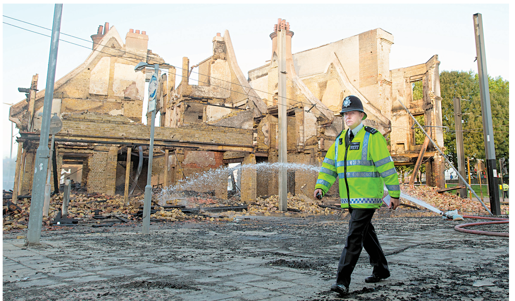
Un policier parcourt une rue dévastée par les émeutiers dans Croydon, au sud de Londres. Immeubles et voitures incendiés, vitrines fracassées... Outre de nombreux dégâts matériels, les émeutes des derniers jours ont fait hier leur premier mort quand un homme de 26 ans, blessé par balle lundi, a succombé. La police londonienne a quant à elle fait état de plus de 110 blessés dans ses rangs.