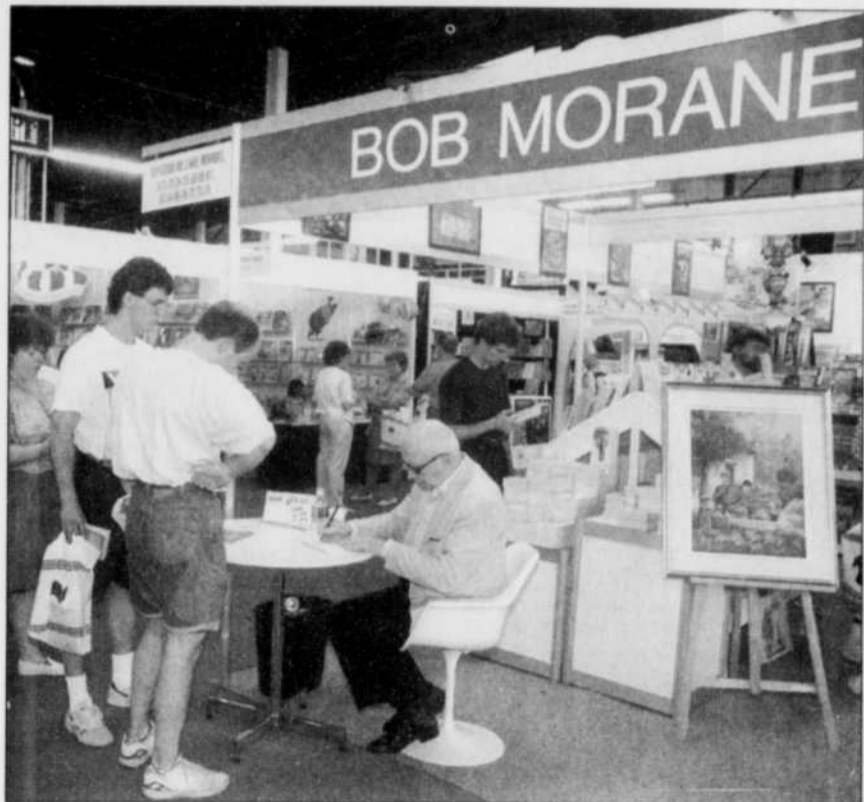
Une fois les écoliers repartis, hier après-midi, seul le stand de Bob Morane —Henri Vernes— profitait d'un certain achalandage.