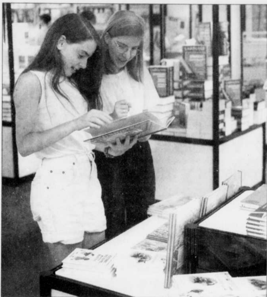
Le Salon du livre, l'occasion de merveilleuses découvertes.