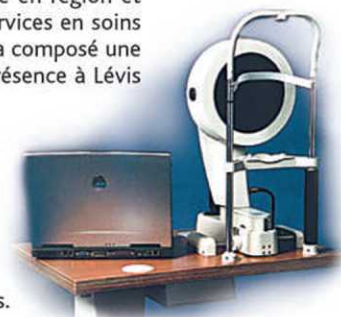
Le Pentacam mesure la courbe et l'épaisseur de la cornée, mesure la profondeur jusqu'au cristallin et offre une multitude d'autres fonctions.