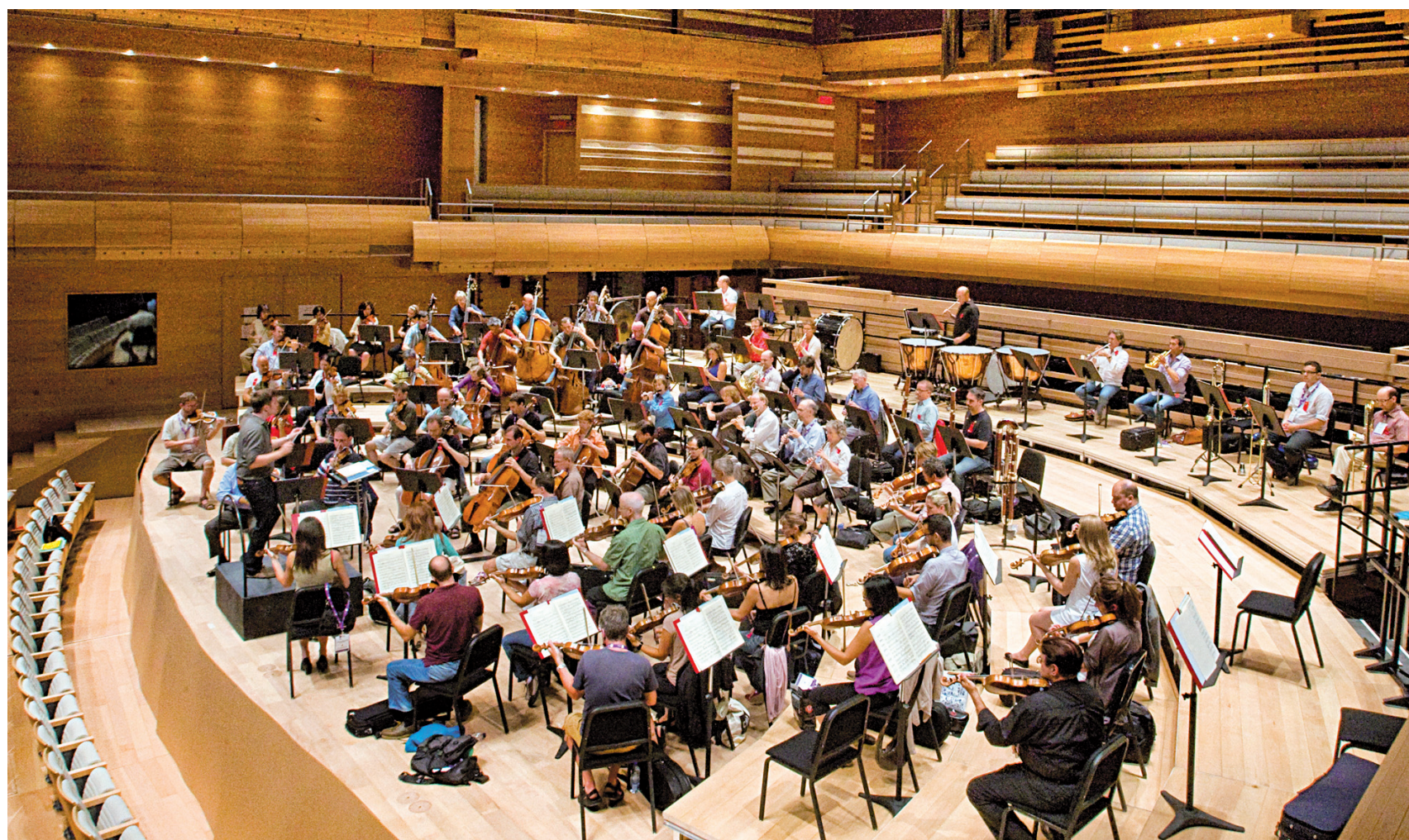
L'Orchestre symphonique de Montréal.

Ainsi, le la 3 du piano possède une fréquence fondamentale de 440 hertz, tandis que celles de ses harmoniques sont de 880 Hz