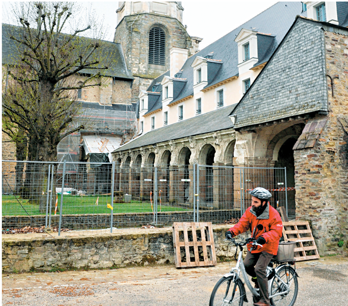
À une centaine de kilomètres de Rennes (notre photo), la Communauté de communes du Pays de Questembert privilégie la culture pour attirer des résidents.

Questembert, qui frôle les 8000 habitants alors que Coaticook en compte presque 10 000, abrite une médiathèque à faire fondre de jalousie, un cinéma où le répertoire a une place de choix et une grande salle de spectacles polyvalente, l'Asphodèle, qui peut accueillir presque 400 spectateurs. L'offre culturelle s'enrichit en plus d'un Festival des arts de la rue qui a lieu durant l'été, d'un Salon du livre jeunesse en mai et de Festimômes à l'automne. Ce seul festival de théâtre destiné aux tout-petits dans tout le Morbihan est