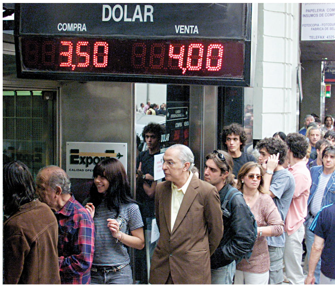
Les Argentins ont encore frais en mémoire les difficultés financières du début du siècle.

Dix millions d'Argentins (sur plus de quarante millions) vivent toujours dans le plus grand dénuement, mais la relance a quand même profité aux plus déshérités. Leur consommation balbutiante est portée par les