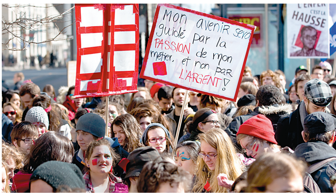
L'IRIS rappelle que le gouvernement du Québec défend la hausse des droits de scolarité en les présentant comme un investissement, «exactement le discours qu'on avait lors de la dernière crise économique avec les subprimes». Sur notre photo, des étudiants manifestent à Montréal contre la hausse des droits de scolarité.

Le chercheur rappelle que le gouvernement du Québec défend la hausse des droits de scolarité en les présentant comme un investissement. «C'est exactement le discours qu'on avait lors de la dernière