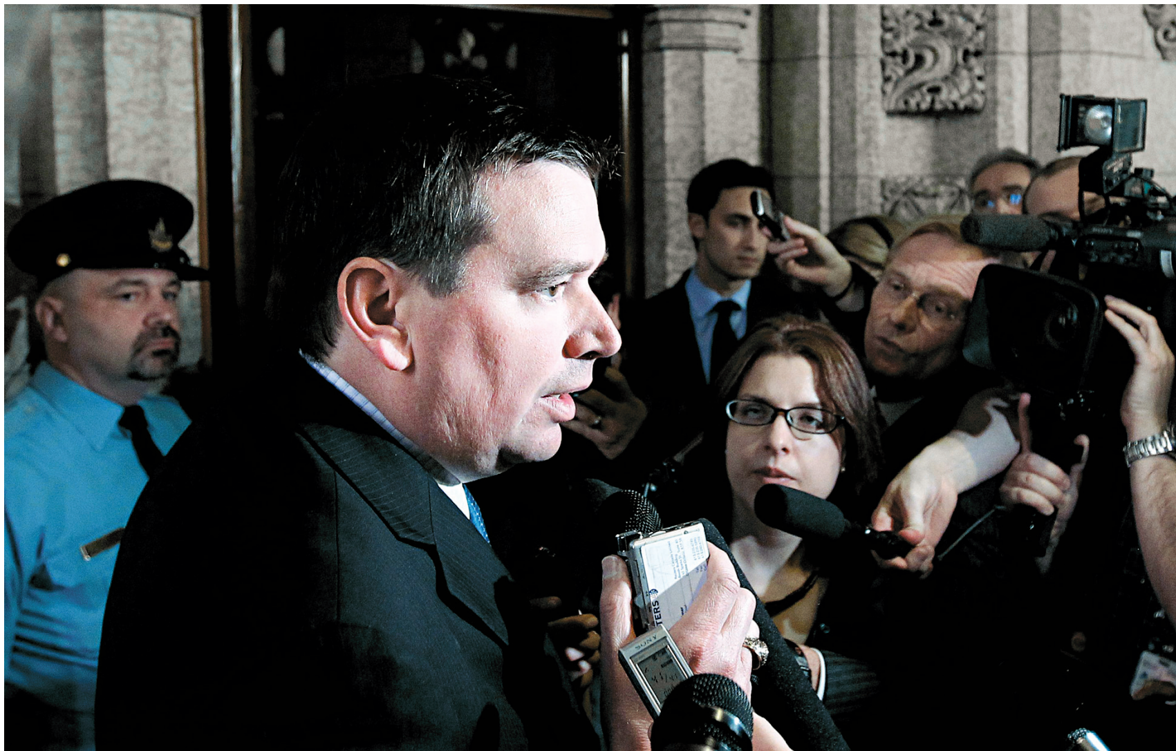
Le ministre Christian Paradis a dû défendre hier son séjour chez Marcel Aubut. «Jamais, en aucun cas, M. Aubut n'a fait du lobbying à mon égard avant ou pendant ce voyage», a-t-il notamment affirmé.

Il y a longtemps que la base conservatrice critique cette situation. Elle sera ravie de voir le gouvernement passer l'appareil fédéral à la moulinette. Mais si faire le ménage n'est pas nécessairement une mauvaise idée — il y a toujours des programmes qui perdent leur pertinence ou s'avèrent mal gérés — les choix à faire demeurent, eux, matière à débat. On ne les connaîtra cependant qu'une fois le budget présenté, un budget qui bouleversera les façons de faire, aux dires des conservateurs.