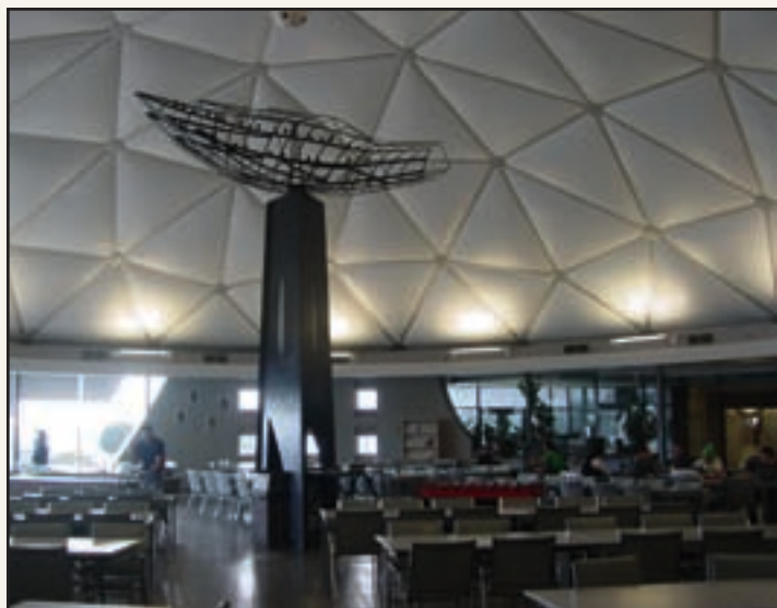
Réfection du dôme du centre intégré de mécanique industrielle de la Chaudière (CIMIC)