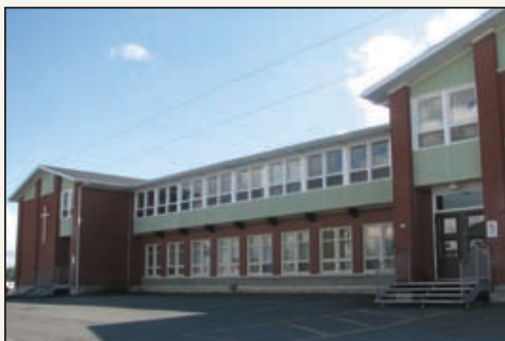
Réfection des fenêtres à l'école du Trait-d'Union de Saint-Prospier

En 2007-2008, le ministère de l'Éducation, du Loisir et du Sport a octroyé à la commission scolaire une somme de 4 060 000 $ permettant la réalisation de vingt-trois projets d'investissement. Ce montant s'inscrit dans le cadre de la mesure d'aide visant prioritairement l'enveloppe architecturale des bâtiments et systèmes mécaniques: toitures, fenêtres, revêtements extérieurs et systèmes de chauffage.