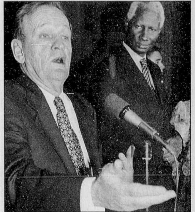
Jean Chrétien, cuisiné sur la question de la TPS, au cours d'un point de presse en compagnie du président sénégalais Abdou Diouf, en visite au Canada.