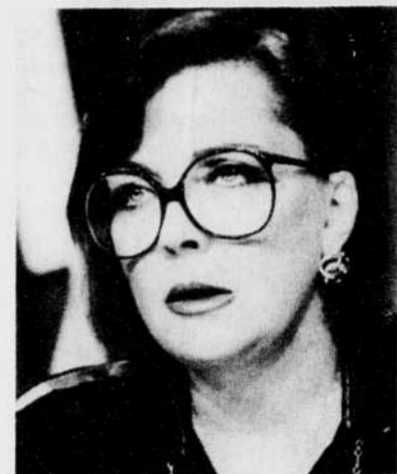
Barbara McDougall, secrétaire d'Etat aux Affaires extérieures du Canada

Il a affirmé que cette approche ne devrait pas être vue comme une ingérence dans les affaires internes du pays. La délégation devrait plutôt être considérée comme un intermédiaire entre la population haïtienne et les responsables du coup, a-t-il affirmé.