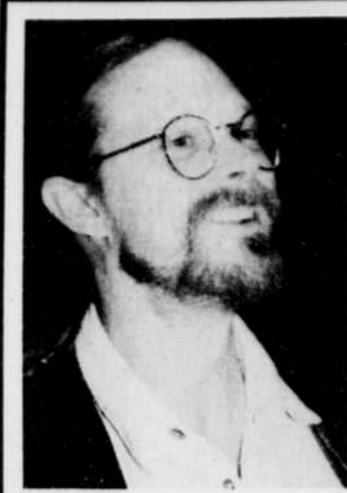
En collaboration avec