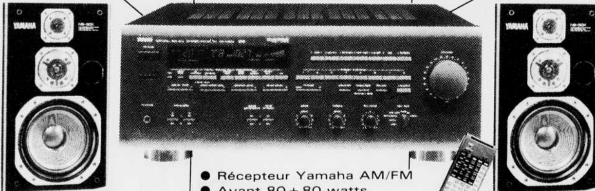
TABLE LASER TÉLÉ VIDÉO CASSETTE