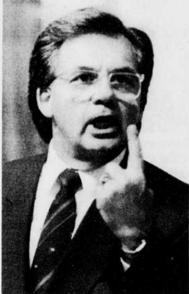
Yvon Picotte, ministre de l'Agriculture, des Pêcheries et de l'Alimentation

Mais quoi qu'il en soit, le ministre Picotte ne cache pas son impatience de voir le dossier constitutionnel réglé définitivement pour pouvoir passer à d'autres problèmes plus criants.