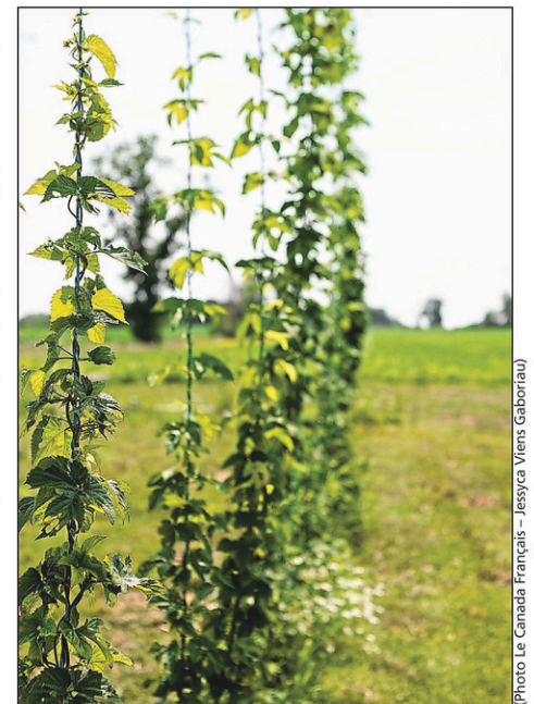
La parcelle de champ qui accueille le houblon biologique est visible depuis le salon de dégustation.

Actuellement, quatre personnes à temps plein et six à temps partiel travaillent à Terre à Boire.