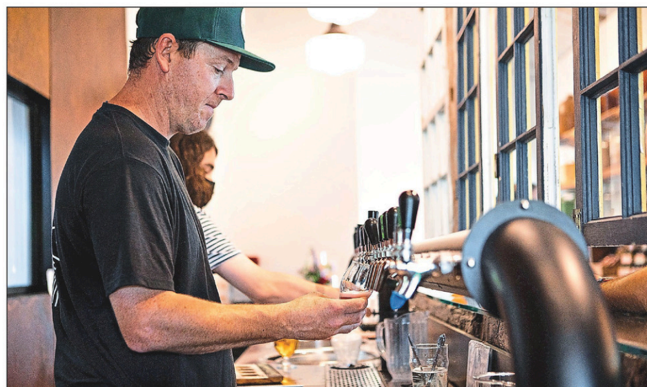
Les bières sont produites à partir d'ingrédients issus des terres de l'entreprise.