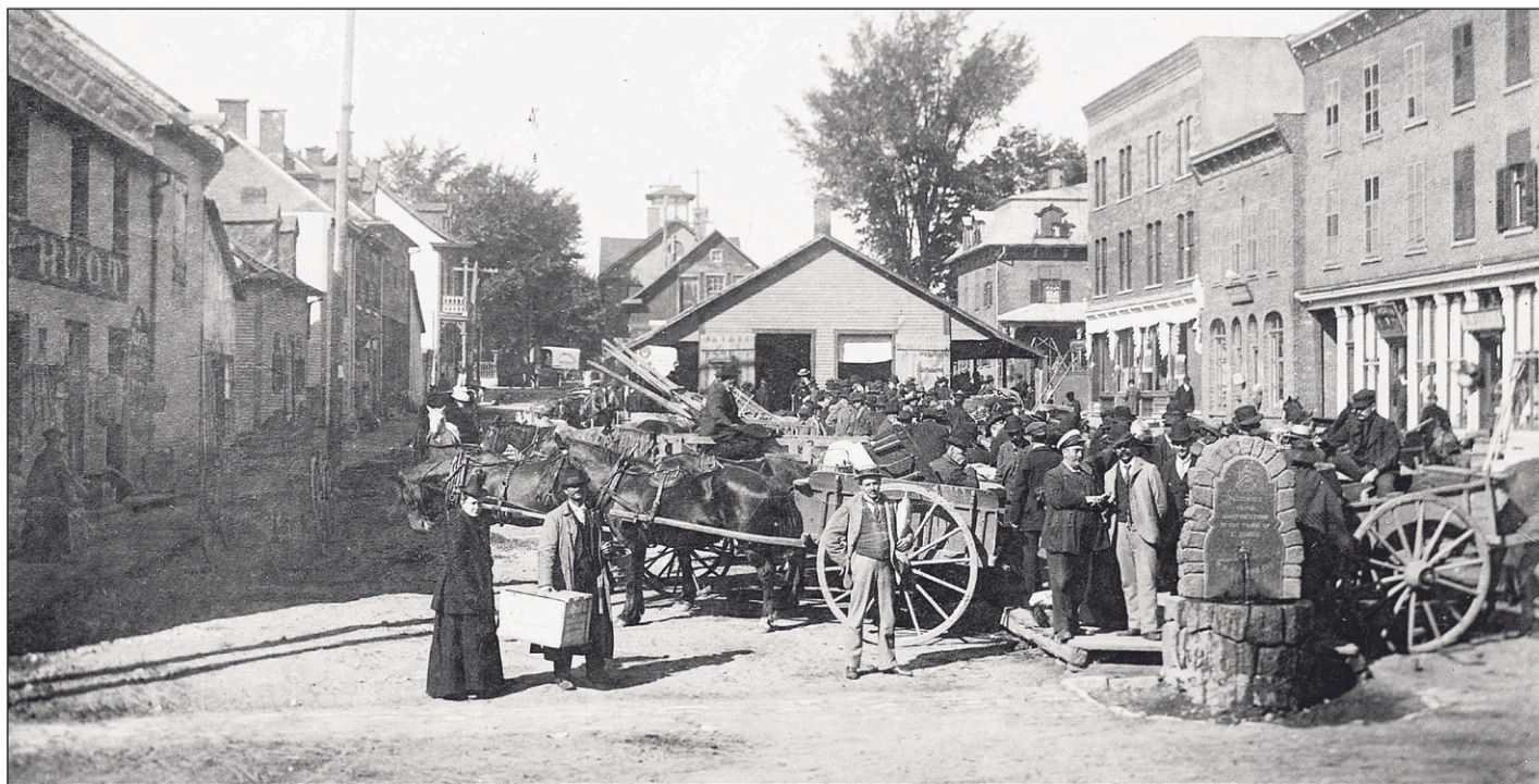
En 1864, on pouvait par exemple se procurer sur la place du marché de la fleur (farine) par quart, du lard frais, de la paille, des volailles par couple et même des pigeons!

Sur cette importante place s'élève un bâtiment de bois circa 1841 et qu'on nomme alors communément le Butcher's Hall, car il sera occupé par les étals des bouchers jusqu'à l'érection de l'édifice de la Place du Marché.