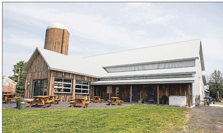
Le bâtiment qui accueille Terre à boire a été construit à partir de matériaux recyclés, comme l'ancienne grange.