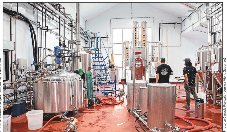
On projette d'y produire des spiritueux comme le gin et le whisky.