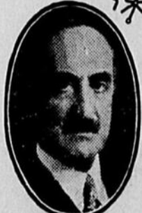
L'Hon. J.-E. PERRAULT Ministre de la Voirie

VOIRIE —C'est sous l'administration Taschereau que la voirie s'est développée. En 1920, nous n'avions que 300 milles de chemins améliorés; en 1935, nous en avons 18,000 milles. Le gouvernement libéral a dépensé 155 millions de dollars en 15 ans pour la construction et l'entretien des routes, et plus de 15 millions de dollars pour la construction et l'entretien de ponts. En 1920, les revenus du tourisme s'élevaient à 3 millions de dollars seulement, tandis qu'en 1935, ils atteignent 60 millions de dollars. Depuis 1920, le tourisme a apporté 400 millions de dollars à notre province.