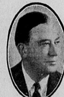
L'Hon. IRENÉE VAUTRIN Ministre de la Colonisation

COLONISATION —Avant l'avènement du régime Taschereau, la province dépensait une moyenne de $146,000 par année pour les fins de colonisation. De 1920 à 1935, le gouvernement a dépensé à ces fins, une somme totale de près de 30 millions de dollars, soit environ 2 millions par année sans tenir compte des primes de défrichement évaluées à $2,800,000. Depuis 1930, plus de 17,000 colons furent établis sur des terres. Durant les cinq derniers mois, 4,500 pères de famille sont retournés à la terre. En plus, 7,925 jeunes gens furent établis au cours de la dernière année en vertu du plan spécial d'établissement des fils de cultivateurs. Le gouvernement a fait davantage, il a aussi placé près de 500 cultivateurs à qui il s'est engagé à verser la somme de $300.00, à faciliter l'achat de terres payables dans quinze à vingt ans et à prêter les deux tiers du montant requis pour l'achat du rouling nécessaire, prêts consentis pour une période de trois ans et sans intérêt.