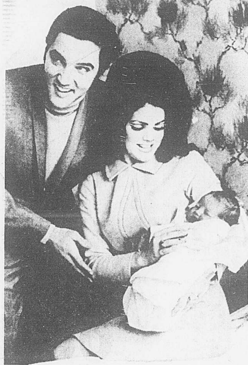
Presley, son ex-femme, Priscilla Beaulieu, et leur fille Lisa Marie, alors âgée de quatre mois. C'était en 1968.

1. Les connaisseurs me reprendront, précisant que le premier succès de Presley, avant «Blue Suede Shoes», fut «That's All Right». D'accord, sauf qu'au Québec ce fut à compter de «Blue Suede Shoes» qu'on sut l'existence d'Elvis Presley.