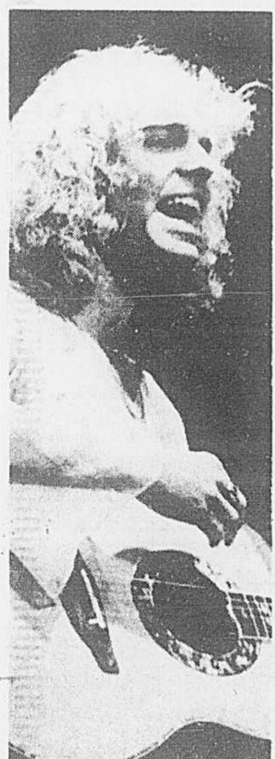
Peter Frampton

Dans le Forum, rempli à pleine capacité, c'était le délire. Les amateurs de musique rock ont été comblés mais non rassasiés puisque, après plusieurs rappels, ils en voulaient encore.