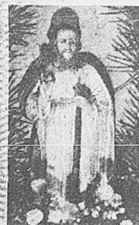
Remerciements à saint Jude pour nos faveurs obtenues. T.F.E.