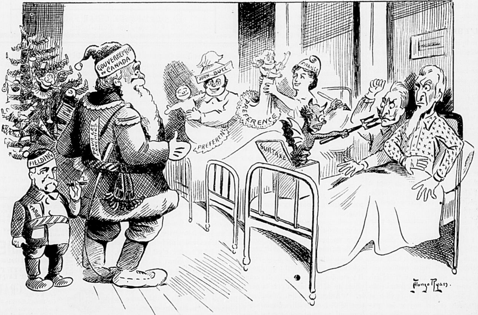
FIELDING—Hourrah ! pour mes trois tarifs. Ce que j'en ai eu une idée. SANTA CLAUS—Oui. Mais tous ne sont pas content également.