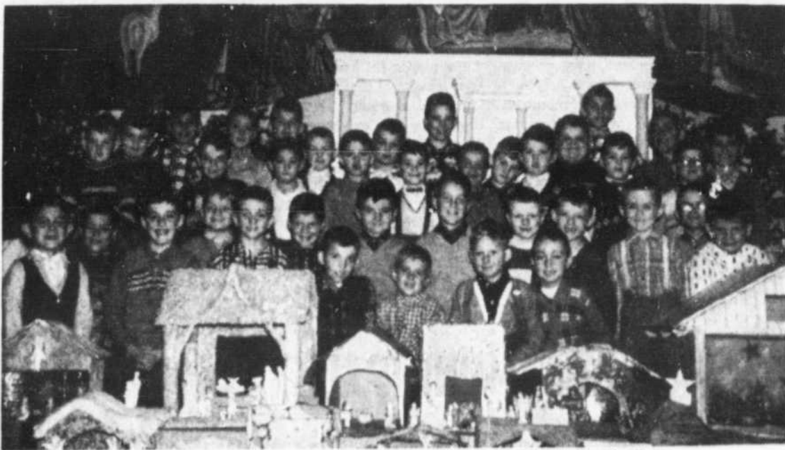
Nous apercevons sur cette photo, un groupe de jeunes de l'Ecole St-Michel de Buckingham. Ils ont fabriqués des crèches à l'occasion de la Noël. N'est-ce pas qu'ils ont l'air heureux !